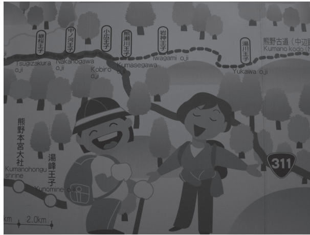
Fig. 5 – Détail de la carte du pèlerinage de Kumano (chemin de Kohechi), gare de Kii Tanabe