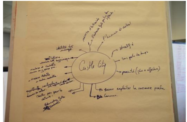
FIGURE 1. DIAGRAMME DE TYPE MIND MAP

Nous avons observé que différentes représentations externes ont émergé pendant la séance de travail. Nous en avons distingué cinq sortes: diagramme type Mind Map, liste répertoire, nuages de post-it, tableau et illustration. Pendant les phases de travail collectif l'animateur notait et organisait les idées des participants sur des tableaux ou flipchart. Des représentations en forme de diagramme type Mind Map (Figure 1), de liste répertoire (Figure 2), de nuage de post-it (Figure 3), ont été construites par le groupe.