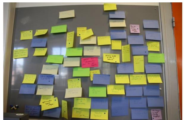
FIGURE 3. NUAGE DE POST-IT