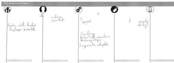
FIGURE 4. TABLEAU

Nous avons choisi pour l'analyse la phase de génération d'idées et donc deux types de représentations émergentes : le diagramme type Mind Map (Figure 1) et la liste répertoire (Figure 2).