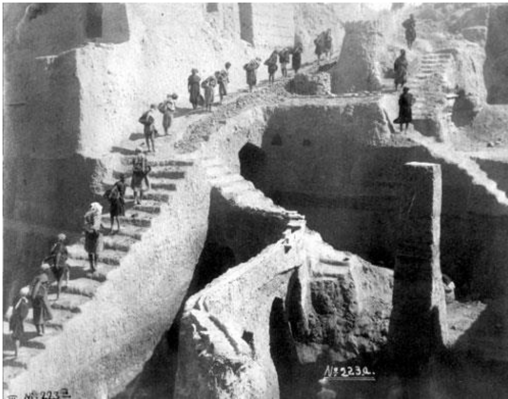
Figure 2 : Fouille de la ziggourat de Nippur

La civilisation de Sumer, particulièrement brillante au troisième millénaire avant notre ère en Mésopotamie méridionale, est à l'origine d'innovations majeures : un état centralisé, la normalisation des poids et mesures, un vaste réseau d'écoles de scribes. Dans ces écoles, que les Sumériens appelaient « Edubba », mot-à-mot « Maison des tablettes », on apprenait aux futurs scribes l'écriture cunéiforme (c'est-à-dire les signes en forme de coins imprimés dans l'argile), la langue sumérienne et le calcul. C'est dans ce contexte que sont nées les mathématiques mésopotamiennes, dont l'âge d'or se situe dans la période dite « paléo-babylonienne » (début du deuxième millénaire avant notre ère). Ces textes d'érudition abordaient des problèmes du second degré et parfois même du troisième et du quatrième degré, des problèmes linéaires ou quadratiques à plusieurs inconnues, des calculs de volume, des algorithmes numériques complexes.