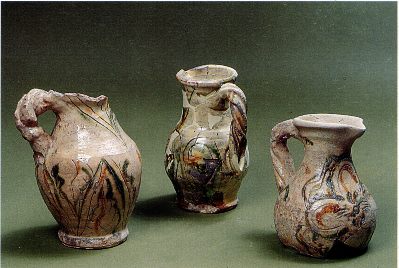
Fig. 116 : Trois cruches vernissées à décor incisé, trouvées à Gap, Sisteron et Saint-Martin-de-la Brasque.