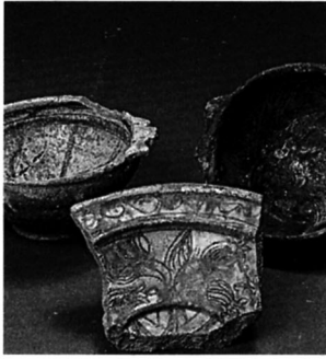
Fig. 93 La Visitation : écuelles et coupe à décor incisé.

casion des découvertes les plus récentes, il conviendrait sans doute d'en étendre le champ afin de confirmer la réalité d'éventuels sous-groupes dont les contours commencent à se dessiner. L'essentiel des trouvailles se compose de vaisselle de table assez commune comprenant des bols, écuelles à marli, coupes en pâte calcaire et quelques pichets ainsi nommés par les textes (fig 117). Les vases sont tous revêtus d'engobe et de glaçure plombifère jaune. Le décor le plus fréquent est peint d'oxydes de cuivre et de fer utilisés pour former des motifs à la croix de tradition assurément pisano-ligure (surtout sur des bols sans oreille (fig. 118).