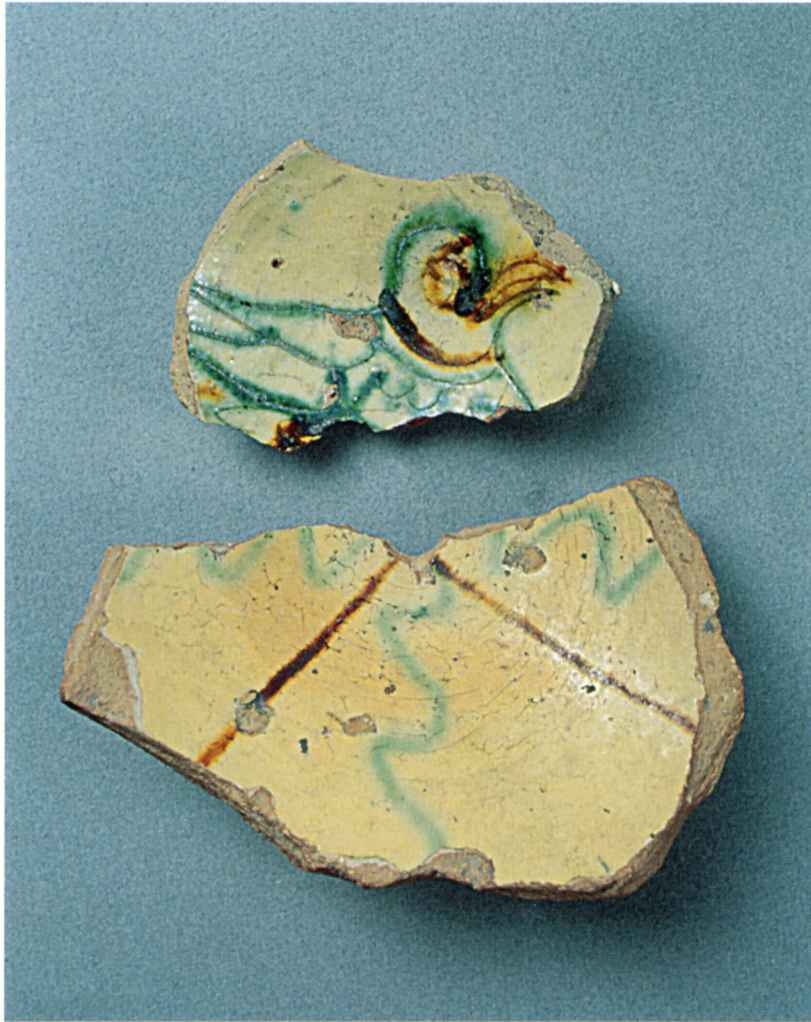
Fig. 115 : Fragments de bol et coupe à décor d'oiseau incisé ou à la croix. Cours des Arès, Digne.