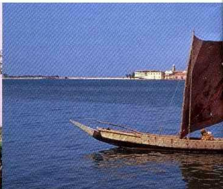
PIROGUE PARTANT POUR LA PÊCHE.