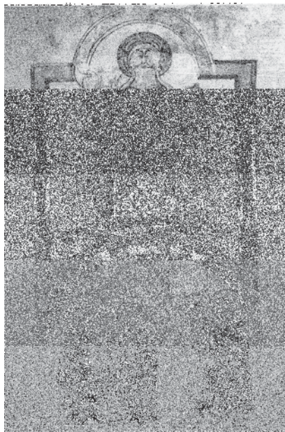
Fig. 12, Rstakēs , Pentecôte, 1397, évangile, Mat. 7629, fol. 9r°.