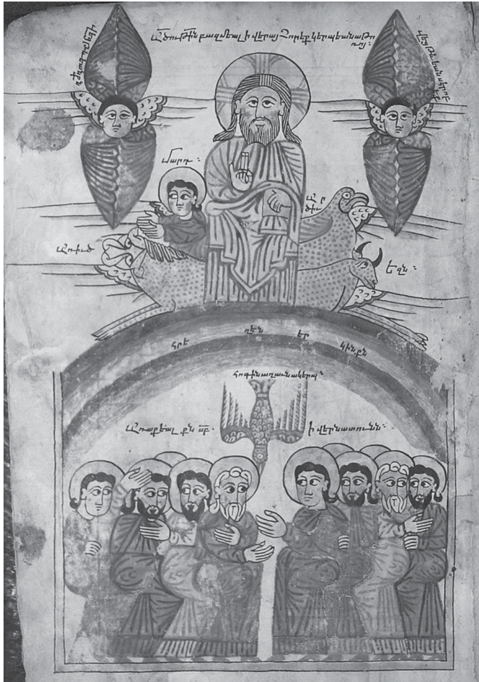
Fig. 14, T'umay Minacenc' , Pentecôte, 1444, évangile, Mat. 4829, fol. 4v°.