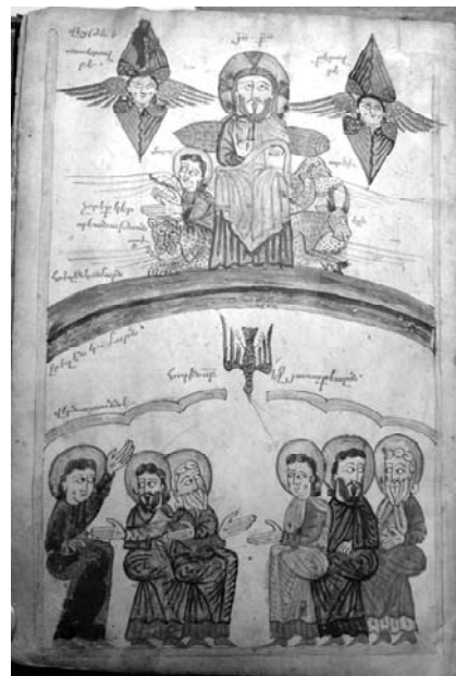
Fig. 13, Karapet Vaneci , Pentecôte, 1421, évangile, Mat. 3716, fol. 6v°.