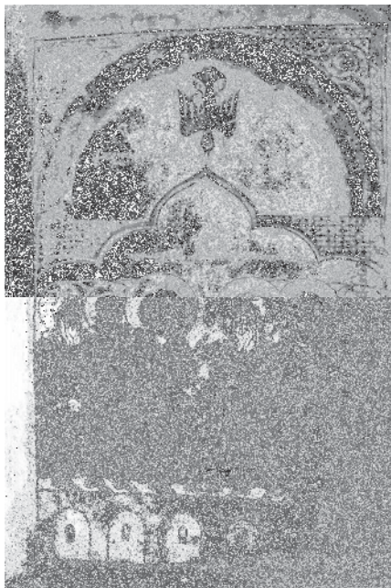
Fig. 4, Yovannēs Xizanc'i , Pentecôte, 1417, évangile, Mat. 5444, fol. 7r°.