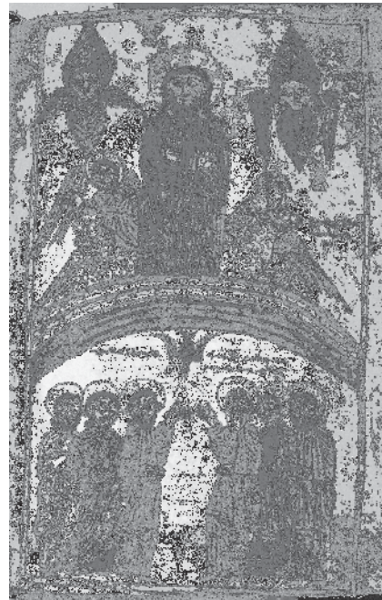
Fig. 9, Daniël , Pentecôte, 1414, évangile, Mat. 5523, fol. 9r°.