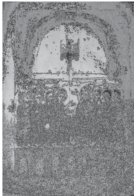
Fig. 5, Karapet Vanec'i , Pentecôte, 1418, évangile, Mat. 4931, fol. 8r°.