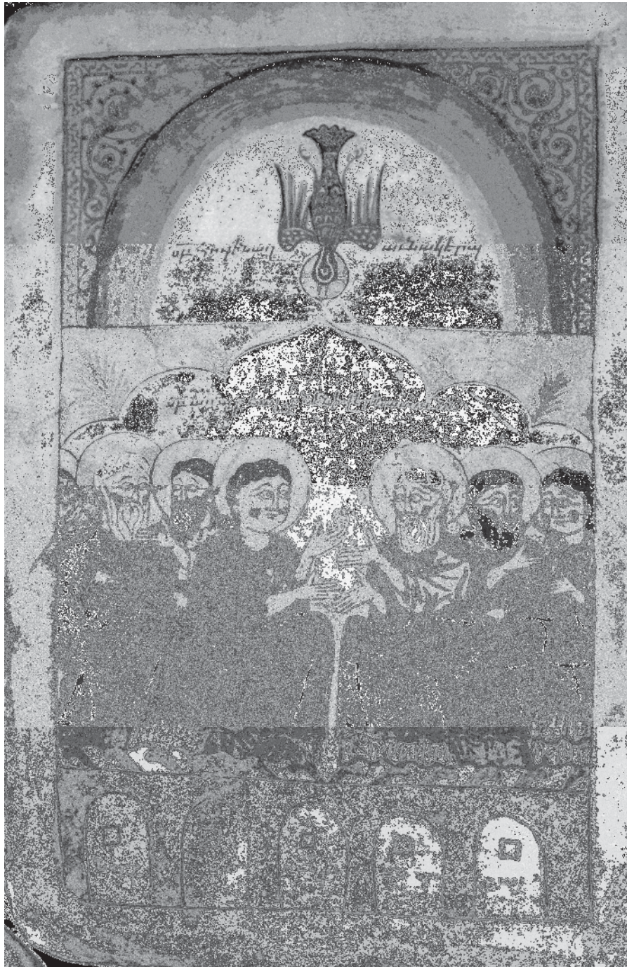
Fig. 1, Yovannēs Xizanc'i , Pentecôte, 1402, Mat. 5562, fol. 9v°.