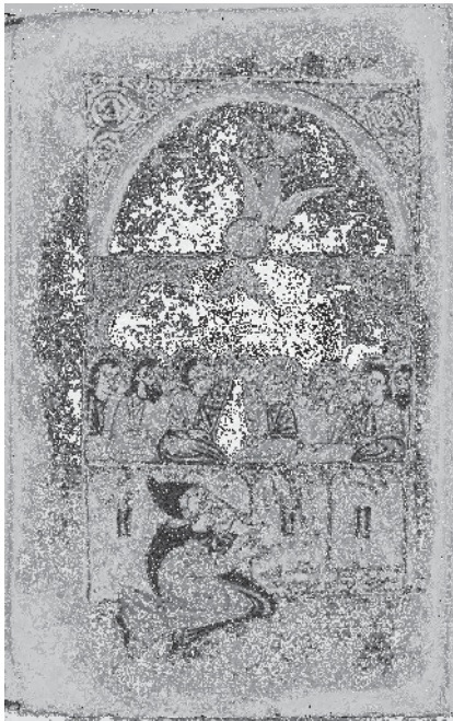
Fig. 8, Xaç'atur (?), Pentecôte, 1435, évangile, Metropolitan 2010.108, fol. 3v°(?).