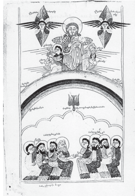
Fig. 11, Cerun , Pentecôte, 1395, évangile, Ermitage VP 1010, fol.1 1v°.