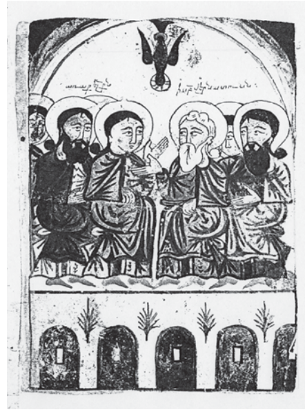
Fig. 7, Mkrtič' , Pentecôte, 1439, évangile, CBL. 565, fol. 6r°.