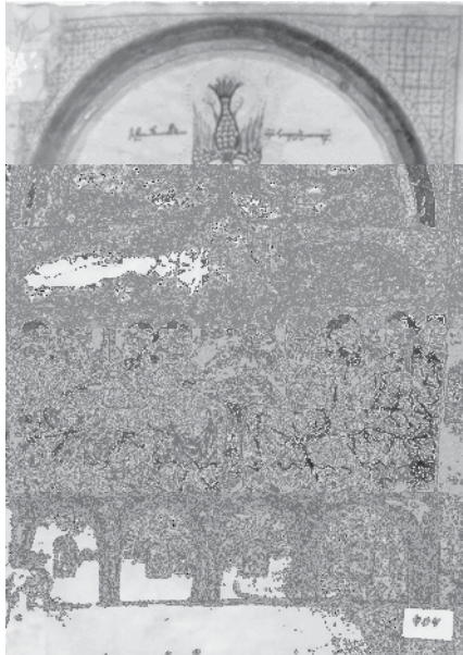
Fig. 2, Yovannēs Xizanc'i , Pentecôte, de 1392 à 1402, évangile, NDj. 404, fol. 6r°.