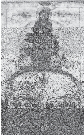
Fig. 10, Kirakos Albakeci , Pentecôte, 1332, évangile, Mat. 9423, fol. 5r°