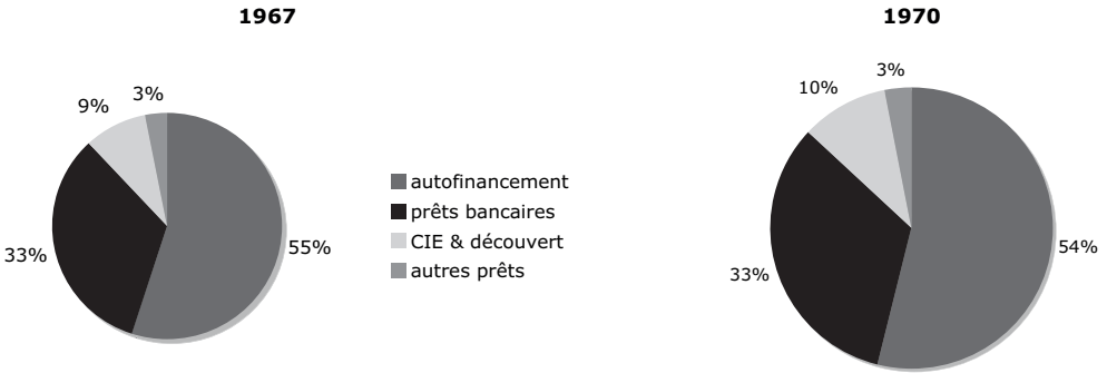
Graphique 1 : le crédit inter-entreprises dans le financement des investissements (source : cf. note 4)

du Plan, s'inquiètent de la propension des artisans à se faire financer par leurs fournisseurs, avec des conséquences négatives sur leurs coûts, le crédit inter-entreprises se révèle en réalité ne représenter qu'un apport secondaire dans la structure de financement de l'artisanat. Les enquêtes de 1967 et 1970 montrent que les artisans se financent principalement sur leurs fonds propres et secondairement avec des prêts bancaires (ceux notamment du crédit artisanal). La modernisation des entreprises artisanales dans les années 1960, qui donne lieu à un fort courant d'investissements, est financée sur cette double base de l'autofinancement et de l'endettement. Le crédit inter-entreprises pèse assez peu dans le financement des investissements : moins de 9 % en 1967, moins de 10 % en 1970.