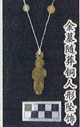
金墓随葬铜人形坠饰