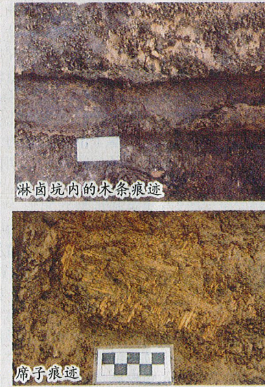
淋卤坑内的木架痕迹