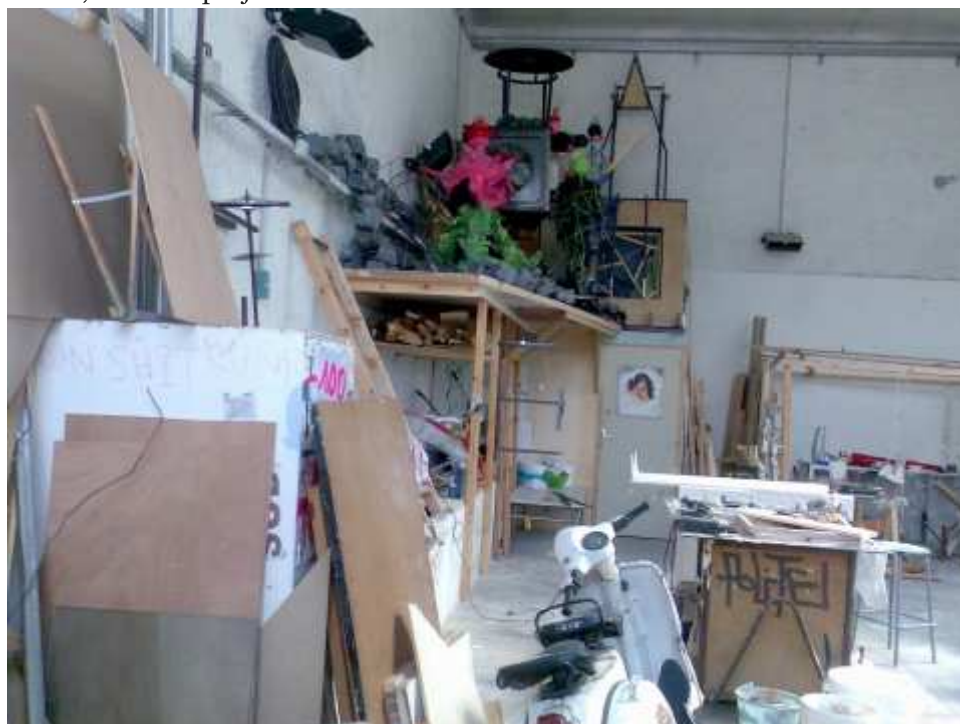
École des Beaux-Arts de Marseille