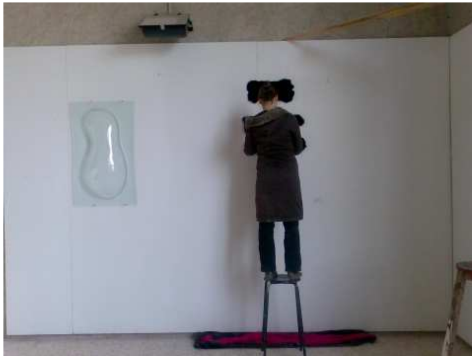
Œuvre en cours aux Beaux-arts de Marseille.