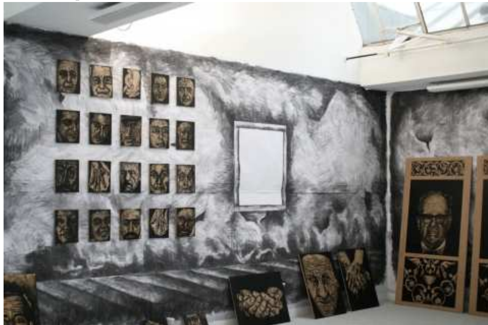
« Accrochage pour la présentation du diplôme de troisième année »

la portée de la comparaison avec les professions disposant d'une licence, on constate qu'aujourd'hui, la majorité des plasticiens sont diplômés d'une école d'art. La question est donc de savoir si la durée spécifique des études aux Beaux-arts s'accorde avec la durée de ce processus individuel consacrant la transformation de l'étudiant en artiste.