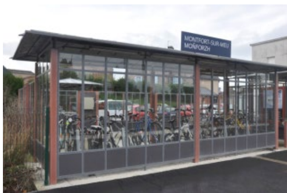
Photos : gare de Montfort-sur-Meu : l'abri couvert et la consigne collective

Le bilan concerne le cas théorique d'une gare située dans le