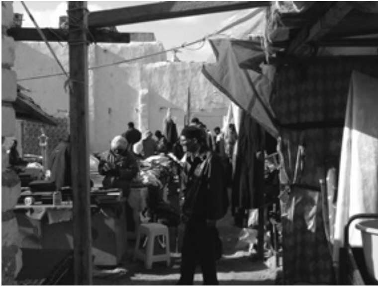
Ilustración 1.3. Soco africano en la antigua ciudad de Trípoli, Libia.

ofrecen alojamiento a los comerciantes extranjeros y de centros comerciales que atraen a los compradores de la capital ha aumentado.