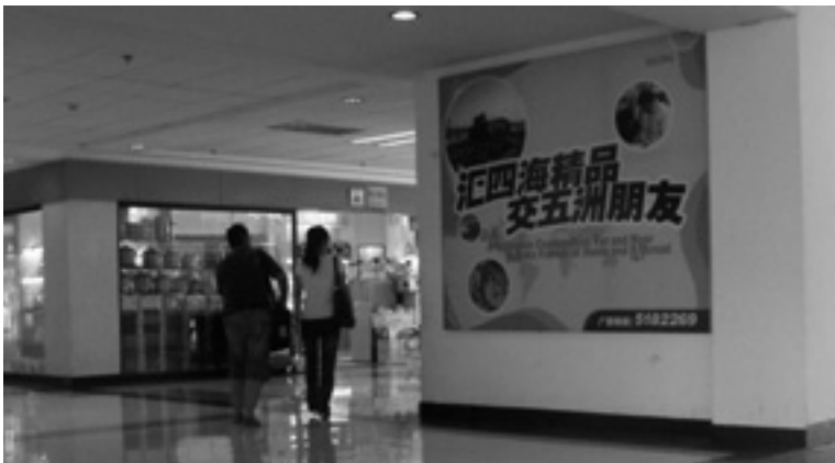
Ilustración 1.4. Un comerciante y su traductora china en los salones del ITC.

El Centro de Comercio Internacional (CCI; ITC, por sus siglas en inglés: International Trading Center), con un total de 17,000 tiendas, proporcionó un lugar accesible a los mercados especializados de Yiwu un año después de que China se uniera a la Organización Mundial del Comercio; el 75 por ciento de las transacciones comerciales que tienen lugar en la ciudad se concentran en él. En 2008, el mercado de Yiwu se dividió en cinco mercados principales (Huangyuan [según la página web]-Binwang e ITC I, II, III y IV) y en calles especializadas-corredores especializados donde se instalan 620,000 puestos de proveedores chinos (Zhejiang China Small Commodities City Group, 2009). Es el corazón del surgimiento de Yiwu como una de las principales fuentes mundiales de las mercancías que alimentan la globalización desde abajo.