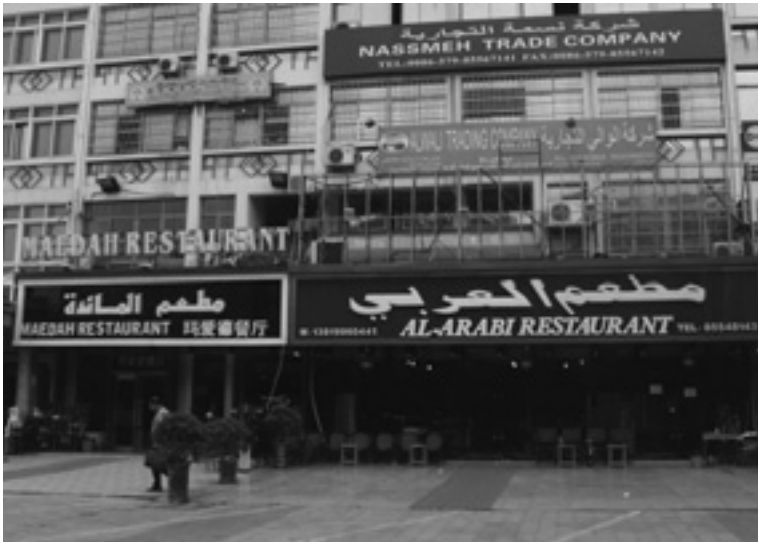
Ilustración 1.5. Restaurante Maedah, el primer restaurante egipcio en Yiwu.

viajantes musulmanes: allí encuentran los alimentos halal , que cumplen con los preceptos del Islam, en especial en un país donde los problemas del idioma son agudos y donde el cerdo y el alcohol son muy populares.