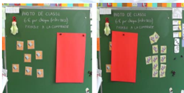
Figure 7 - Système d'étiquettes année 1

En année 1, nous repérons le type d'orchestration « Duo logiciel matériel ». Dans cette orchestration, un matériel tangible est introduit en lien avec la tâche proposée dans le logiciel. Mia a recours à un système d'étiquettes manipulables au tableau créé pour l'occasion à partir de captures d'écran du logiciel (Figure 7). Mia appelle ce dispositif son « TNI artisanal ». Elle transpose en environnement tangible la tâche proposée dans le logiciel. Elle ne dispose pas d'un équipement lui permettant de projeter l'écran du logiciel. L'écran d'ordinateur est jugé trop petit. Il y a pour Mia un manque de ressources adaptées à ses objectifs didactiques, nous repérons dans cette création de ressources un phénomène d'instrumentalisation.