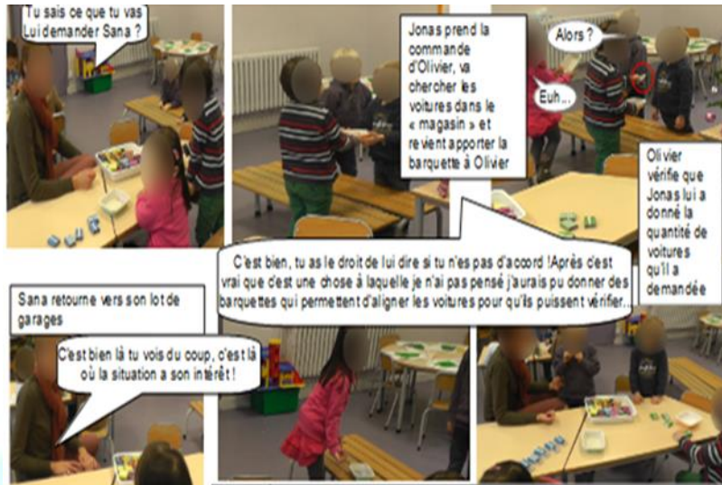
Figure 6 - « Retour au matériel », situation de communication

dans l'extrait d'entretien précédent. Cette évolution est observable lors de la séance 22 (figure 6).