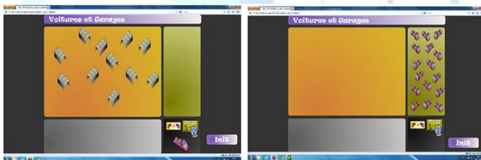
Figure 1 - Deux écrans du logiciel voitures et garages. Les garages sont affichés, puis disparaissent. Les élèves doivent placer le bon nombre de voitures dans la zone grise avec la souris.

La situation VG est inspirée d'une situation conçue par le groupe ERMEL (Charnay et al. 2005). Les élèves ont à disposition un lot de garages et doivent aller chercher en un seul trajet, dans un endroit éloigné (pour ne pas permettre un contrôle perceptif), juste ce qu'il faut de voitures pour que chaque garage ait une voiture et qu'il ne reste pas de voitures sans garage. Cette situation peut se pratiquer avec du matériel tangible : par exemple des petites voitures en plastique et des boîtes d'allumettes. Le groupe MARENE a conçu un logiciel qui reproduit cette situation sur ordinateur (figure 1).