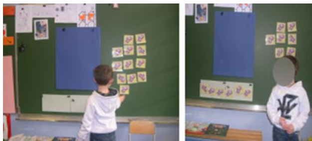
Figure 8 - Système d'étiquettes année 2