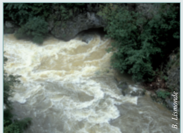
> Figure 6 - En crue, les eaux turbides de la Goule noire [97], émergence du val d'Autrans-Méaudre en Vercors, se mêlent aux eaux plus claires de la Bourne.