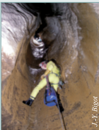
< Figure 5 - Transfert vertical dans la zone non saturée. Puits sec à l'étiage et arrosé par une cascade en période de crue. Scialet du Triou, massif du Vercors, Isère.