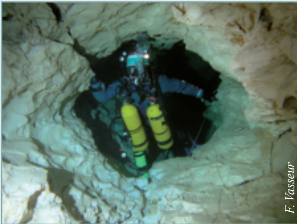
Figure 1 - Premier siphon à -20 m dans la zone noyée de la grotte de Rochecolombe (Ardèche).

manière discrète (c'est-à-dire en découpant le karst en de multiples éléments référencés dans l'espace) en faisant évoluer au cours du temps un modèle géologique numérique 3D détaillé du secteur d'étude intégrant l'ouverture de conduits karstiques.