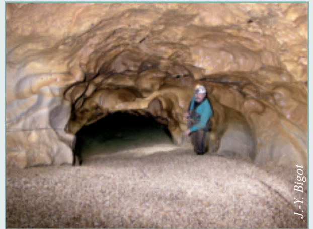
Figure 2 - En crue, le niveau du siphon de la grotte du Revest (Gourdon, Alpes-Maritimes) s'élève et inonde la zone épinoyée. La vitesse de l'écoulement ascendant mobilise les graviers visibles au premier plan.