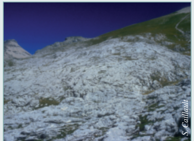
Figure 4 - L'épikarst, intensément fissuré et végétalisé, a la capacité d'emmagasiner temporairement une partie de l'infiltration, dont l'écoulement est différé. Lapias de la Combe des Buissons, massif du Dévoluy, Hautes-Alpes.