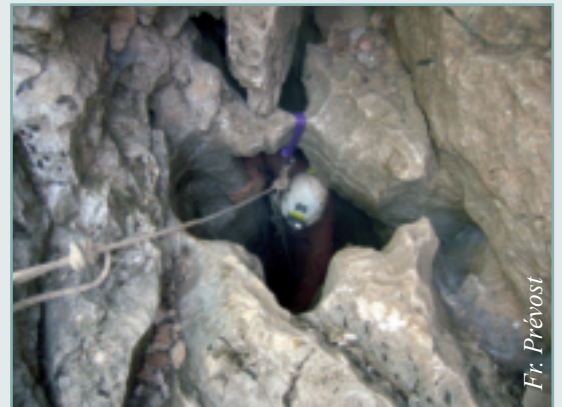
Figure 3 - Puits-perte étroit en diaclase de l'entrée de l'aven du Caveau. La roche est lavée par l'introduction concentrée d'eau en période d'orage.