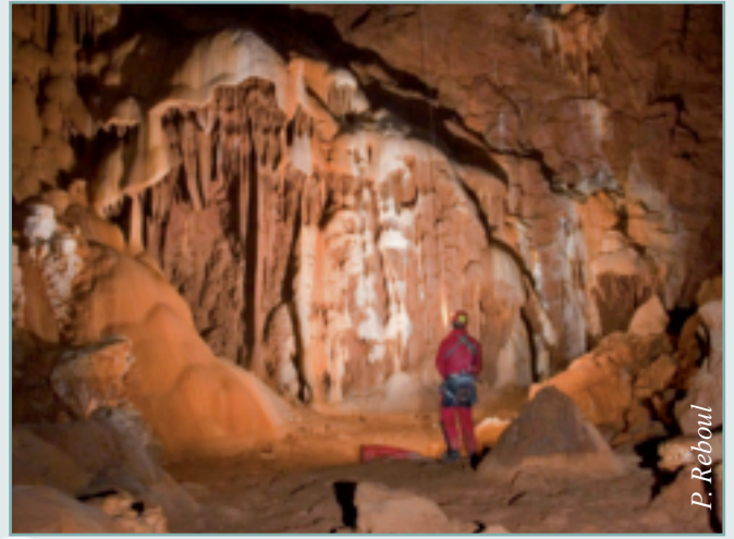
Figure 4 - Salle de l'Appréhension dans l'aven Thipaughanahé, seul grand volume (30 m de diamètre) développé dans les calcaires urgoniens massifs. La salle est couverte de concrétions et de stalagmites en piles d'assiettes