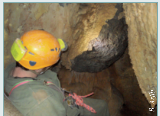
Figure 3 - Puits-perte étroit en diaclase de l'entrée de l'aven du Caveau. La roche est lavée par l'introduction concentrée d'eau en période d'orage.