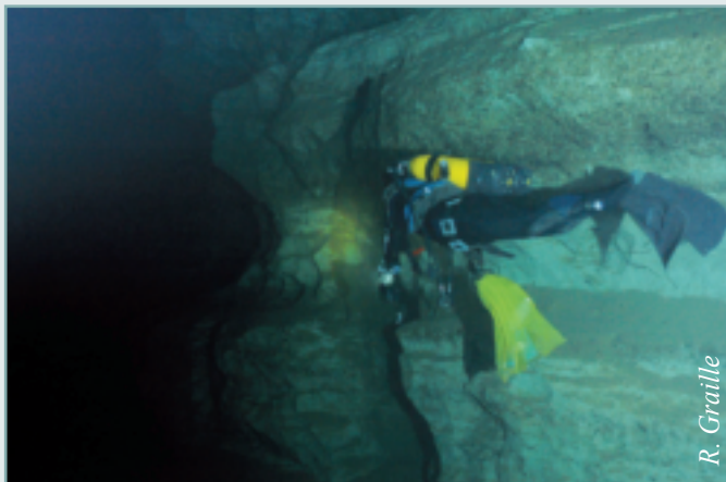
< Figure 2 - La galerie principale de la rivière souterraine de Port-Miou en amont du barrage souterrain.