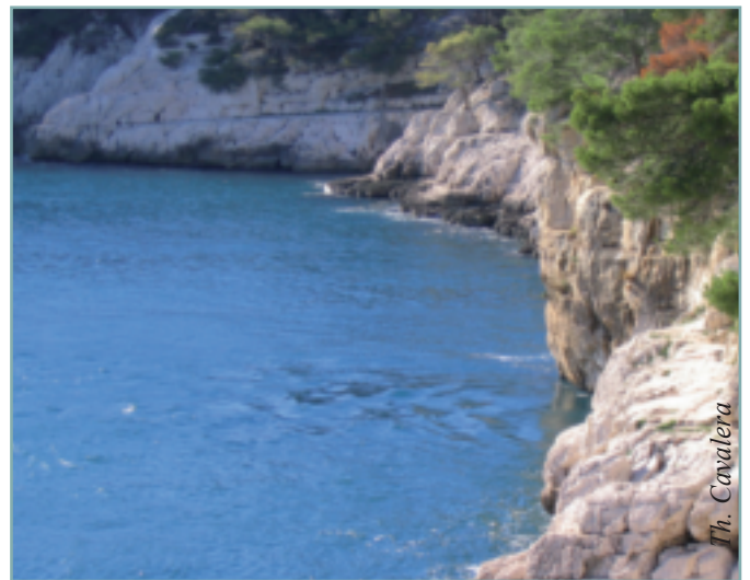
Figure 1 - La source sous-marine de Port Miou en crue, décembre 2006.

L'étude hydrogéologique montre que les deux sources appartiennent au même aquifère, un bassin versant d'une superficie minimale de 400 km 2 (fig. 4).