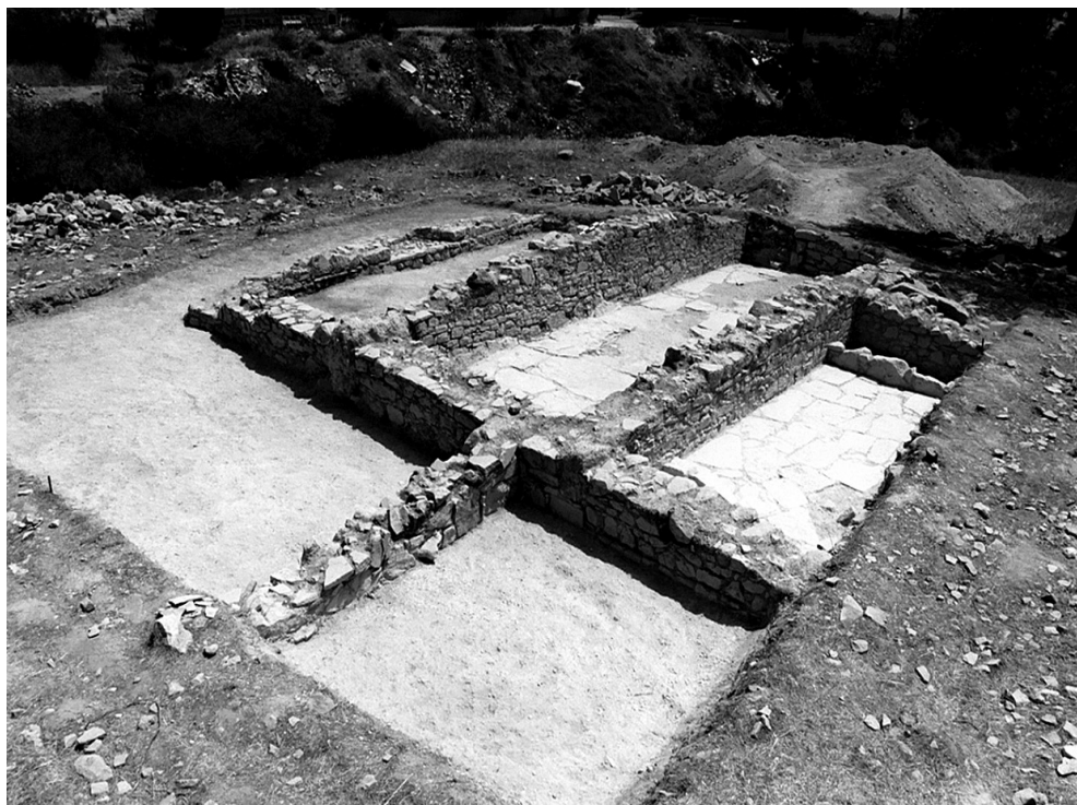
Fig. 4. — Le bâtiment paléochrétien de la zone Sud à la fin de la campagne.

La pièce Ouest, partiellement fouillée, est d'une longueur inférieure aux deux autres. Elle a conservé la plus grande partie de son dallage en calcaire. Dans la partie Sud, une petite fosse a été ménagée contre le mur de séparation avec la pièce située dans le prolongement, qui n'a pas encore été dégagée : dans l'angle Nord-Est un petit foyer témoigne d'une occupation postérieure à l'abandon du bâtiment.