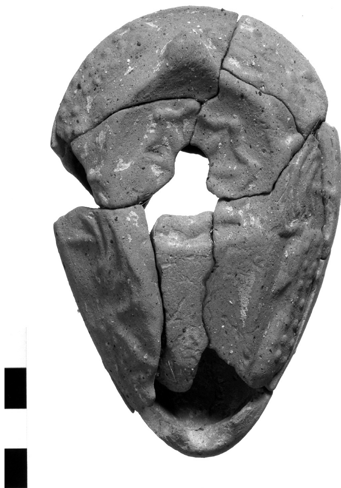
Fig. 6. — Lampe en galet paléochrétienne, inv. S1.12.2.