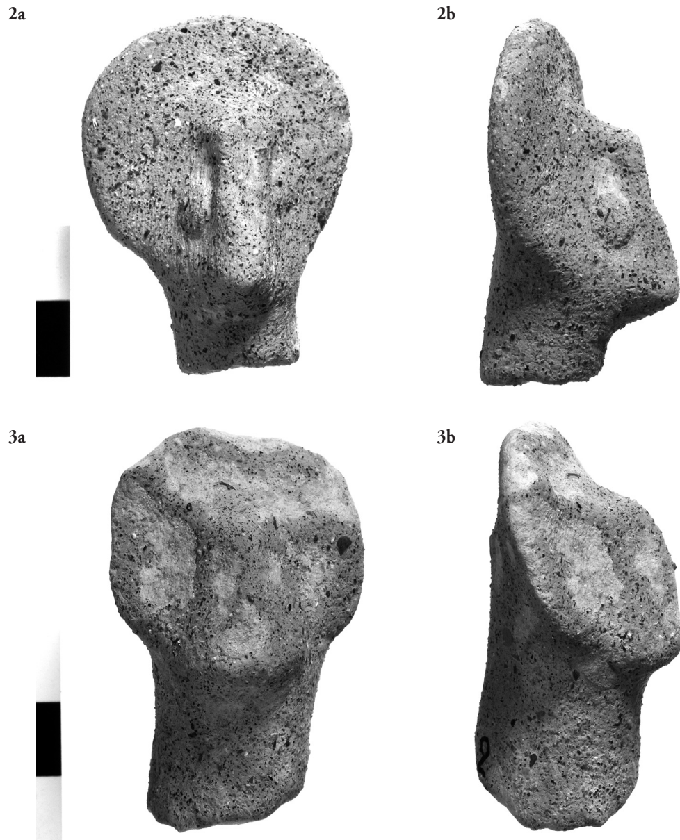
Fig. 2a et b. — Tête de figurine en terre cuite, inv. S5.2.1.