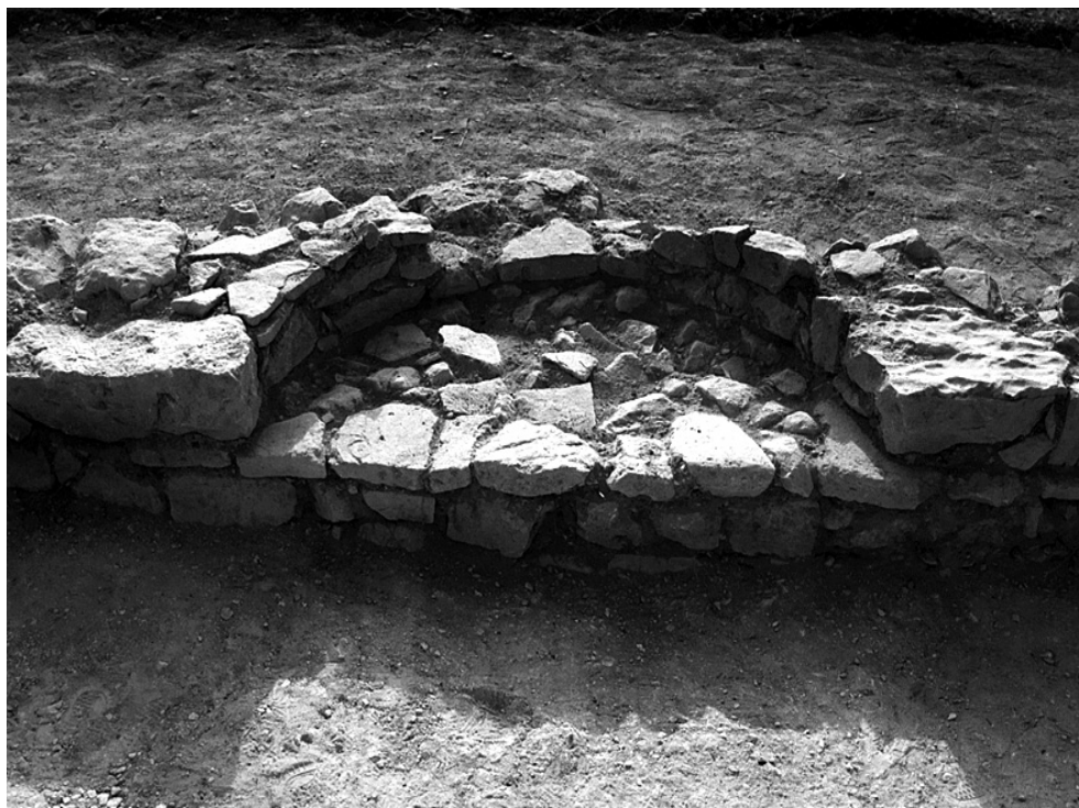
Fig. 5. — La petite abside de la pièce orientale.

La couche de destruction, apparemment progressive et naturelle, qui occupe l'intérieur des pièces, contient très peu de matériel archéologique, mais il est suffisamment significatif pour que l'on puisse dater approximativement cet ensemble. Les tessons d'amphores du type Late Roman 1B, les fragments de tuiles, de lampes en verre ou en terre cuite ( fig. 6 ) nous incitent en effet à proposer une datation vers l'époque paléochrétienne tardive, probablement la fin du VI e s. ou la première moitié du VII e s. apr. J.-C. Cette datation devra être confirmée après la fouille du reste du bâtiment, et l'on devra établir si celui-ci a été construit en plusieurs phases ou réaménagé.