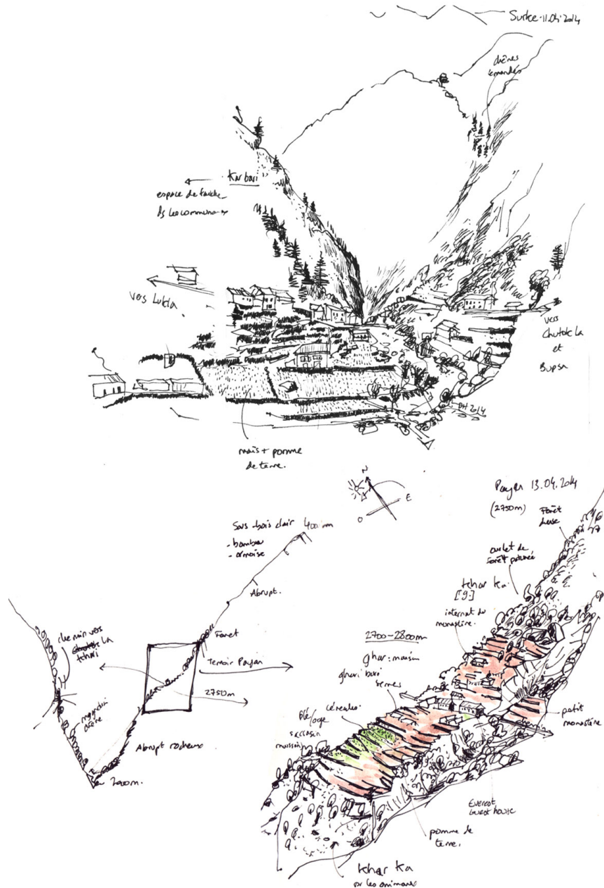
Dessins : Dominique Henry, 2014

installées dans le fond du vallon élargi, et en terrasse en contrebas du chemin où les habitations, commerces et lodges s'y regroupent. Tandis que certains des chercheurs présents observent l'organisation paysagère, la disposition des cultures (dont l'implantation de serres froides bâchées de plastique) et la prise d'eau sur la rivière, d'autres s'entretiennent avec le gérant de la microcentrale hydroélectrique qui alimente le quartier en électricité. À Poyan, c'est après avoir observé les détails de ce versant agricole fortement aménagé, que le chemin, en gagnant le versant opposé, nous a permis d'en comprendre et d'en saisir l'organisation générale « en auréoles » autour de l'axe de circulation. Entre les ramures des chênes et des magnolias, le dessin est l'outil le plus aisé pour rendre compte des observations, à savoir ici encore le rôle économique du chemin qui regroupe les habitations récentes, l'installation de serres en contrebas des plus importants lodges, l'étagement des cultures en terrasse – production de légumes au plus proche des lodges –, pommes de terre et céréales, avant de trouver une épaisse lisière pâturée de chênes émondés.