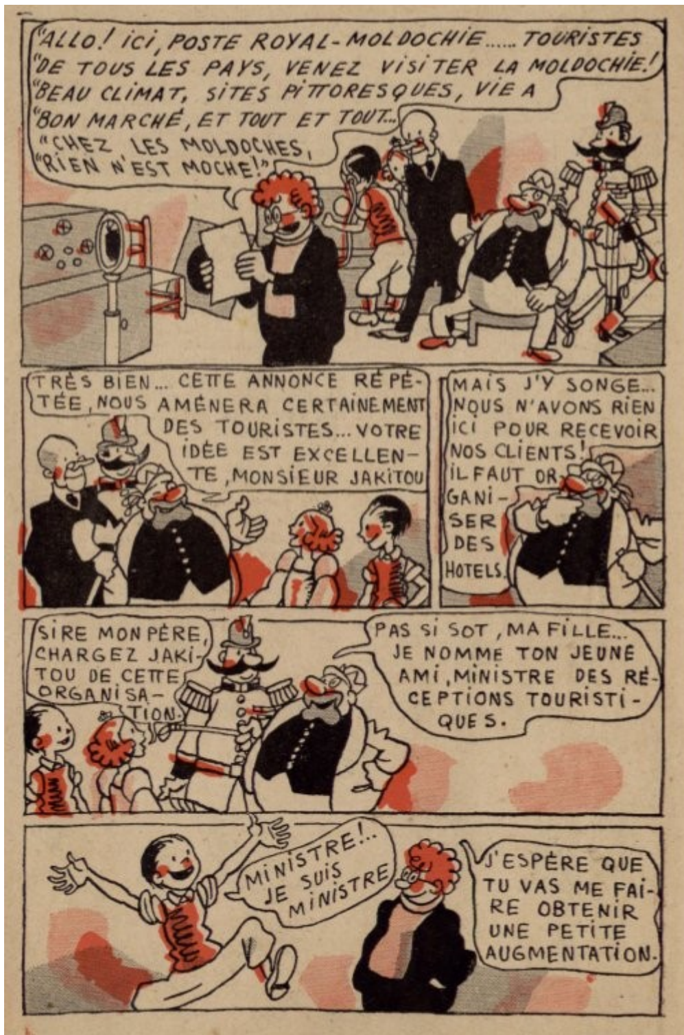
Illustration 2: Jakitou, dans Cadet-Revue (1er juin 1936)