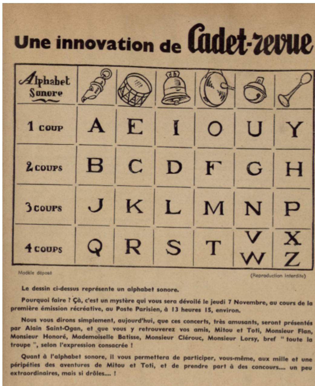
Illustration 3: La grille de l'alphabet sonore pour le feuilleton radiophonique "Mitou et Toti : à la recherche de la phrase magique", dans Cadet-Revue, 1935