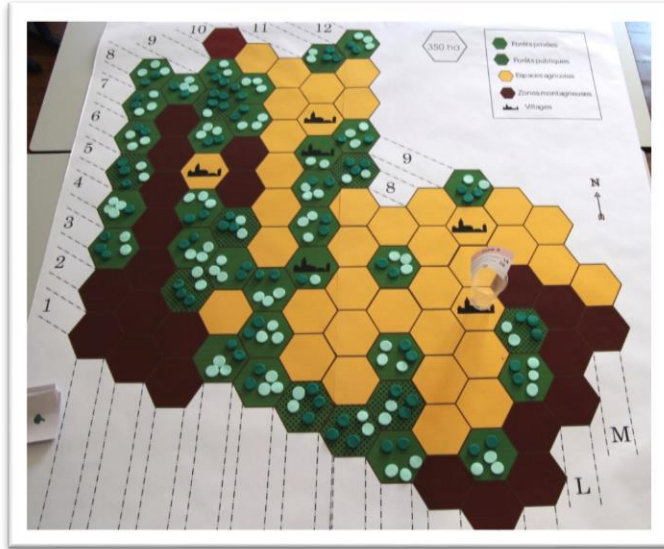
Figure 1. Plateau de jeu représentant le territoire du Trièves