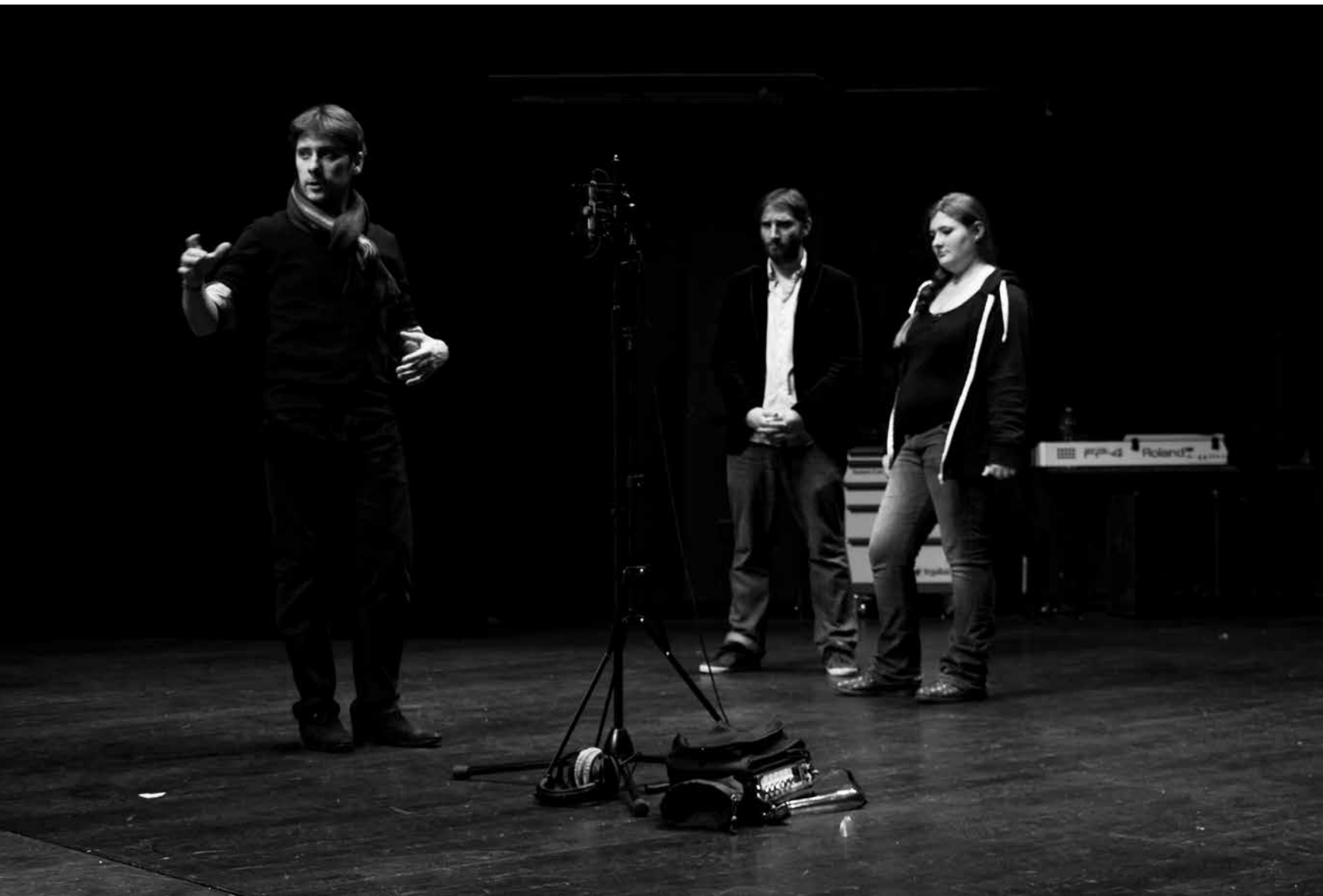
Séance d'enregistrement. Photographie : @ Alice Mesnard .....