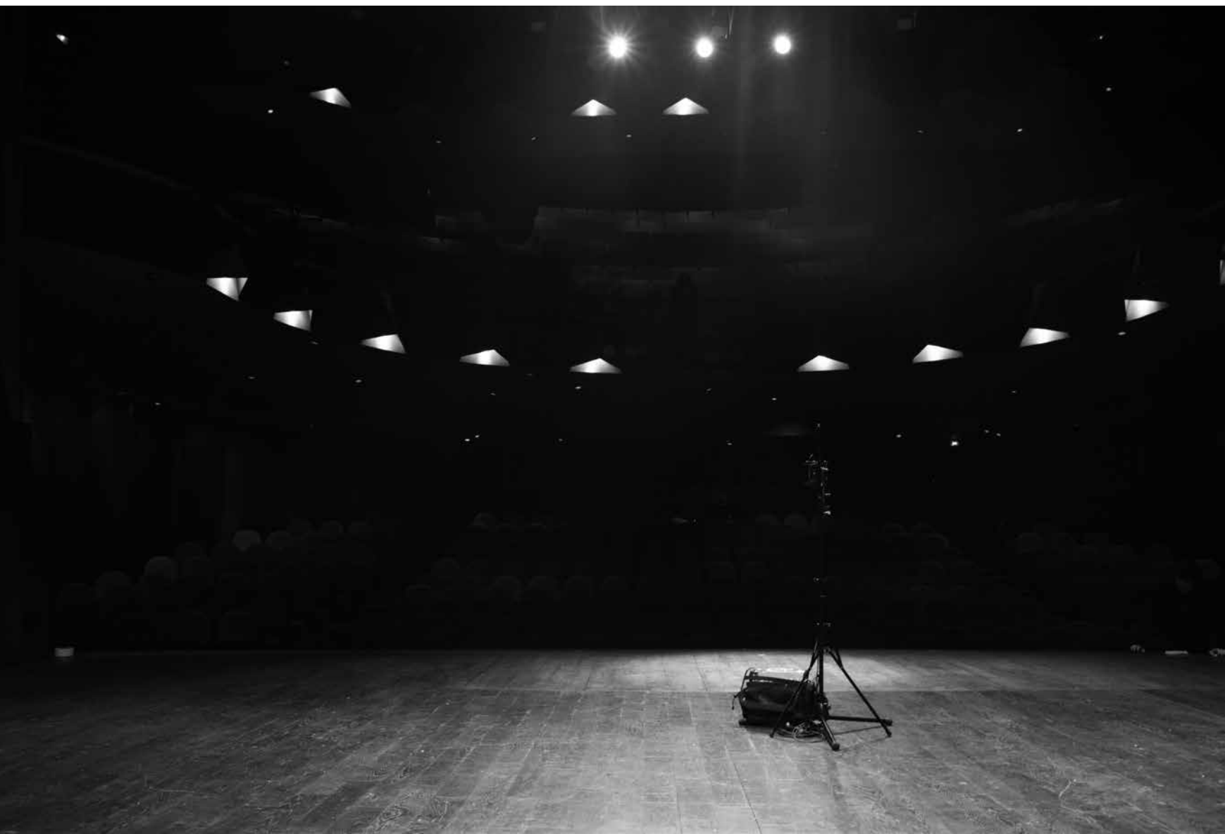
Séance d'enregistrement.