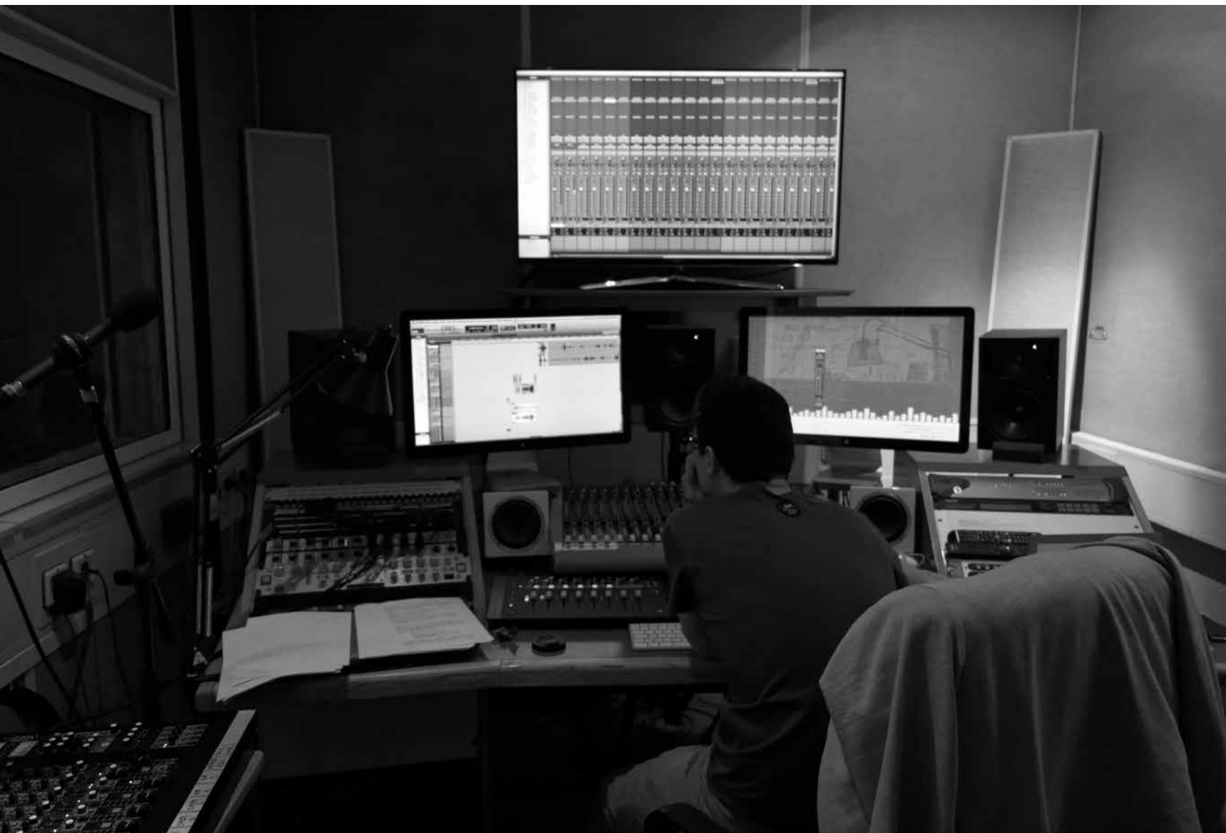
Séance d'enregistrement. .....