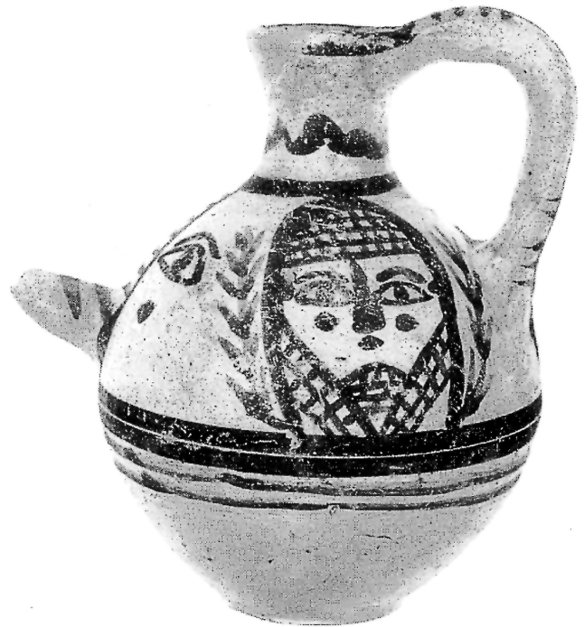
Fig. 10.4. Cruche d'Amathonte T. 194/18, musée de Limassol (d'après Hermary 1997, pl. LI b).