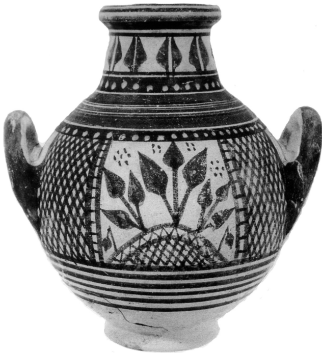
Fig. 10.3. Amphorisque d'Amathonte T. 204/27, musée de Limassol (d'après Hermary 1997, pl. LII e).