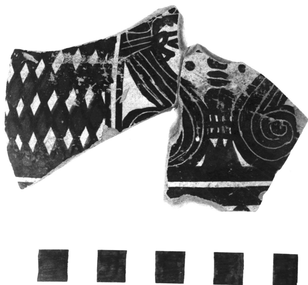
Fig. 10.5. Fragment découvert dans le dépôt du rempart nord d'Amathonte.