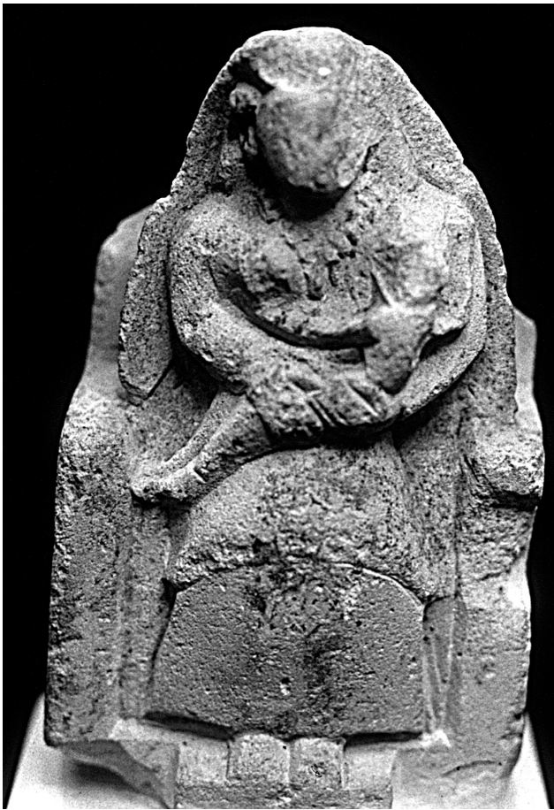
Fig. 10.1. Groupe de Naucratis, British Museum B 463 (d'après Pryce, F. N., 1928, Catalogue of Sculptures in the Department of Greek and Roman Antiquities of the British Museum I.1 , Londres, 197, fig. 238).

Si nombre de traits égyptisants du répertoire « chyro-ionien » trouvent des parallèles dans l'art syro-palestinien (représentations de sphinx ou de faucons, par exemple), certains y sont inconnus et suggèrent la reprise directe de modèles égyptiens. M. Yon l'a bien montré pour un groupe de petits lions découverts à Salamine (Yon 1974). Il est possible que la série des sculptures « chyro-ioniennes » ait joué le rôle de relais dans la transmission à Chypre de motifs égyptiens que l'artisanat phénicien ne connaît pas. Un groupe, découvert à Naucratis, représente un personnage féminin trônant, allaitant un enfant (Fig. 10.1). La façon tout à fait caractéristique de figurer l'enfant est citée, plus qu'elle n'est imitée, sur une série de figurines de terre cuite moulées, provenant de Lapithos (Yon et Caubet 1988, 6–8). La posture de l'enfant se retrouve sur des vases plastiques égyptiens de faïence représentant une femme accroupie tenant sur ses genoux un animal, plus rarement un enfant, et portant dans le dos un enfant maintenu dans une sorte de