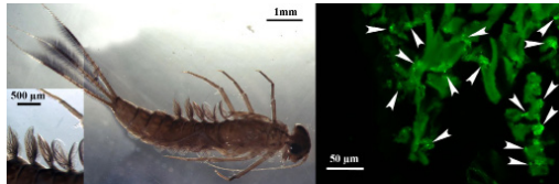
Figure 2 : a) Vue in toto d'une larve de Cloeon dipterum (stage 5). b) Détail des trachéo-branchies. c) Localisation des protéines HSP70 par immuno-histo-chimie confocale dans les trachéo-branchies d'une larve de C. dipterum .

Les observations en microscopie confocale révèlent la présence des protéines HSP 70 dans les cellules chloracogènes localisées sur le corps et les trachéo-branchies des larves de C. dipterum issues de la roubine [Fig. 2]. Ces observations sont en accord avec celles de De Jong et al. (2006) et permettent de passer à la quantification de ces protéines par la technique ELISA sur les larves entières.