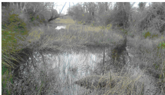
Figure 1 : Vue du site de prélèvement dans une roubine de la plaine de la Crau (Camargue, France).

Les prélèvements ont été effectués dans une roubine située à proximité d'une plate-forme logistique de stockage, située dans le sud de la plaine de Crau (Camargue, France), juste après sa mise en place (latitude : 43 ; 28 ; 16,9 et longitude : 4 ; 52 ; 37,1).