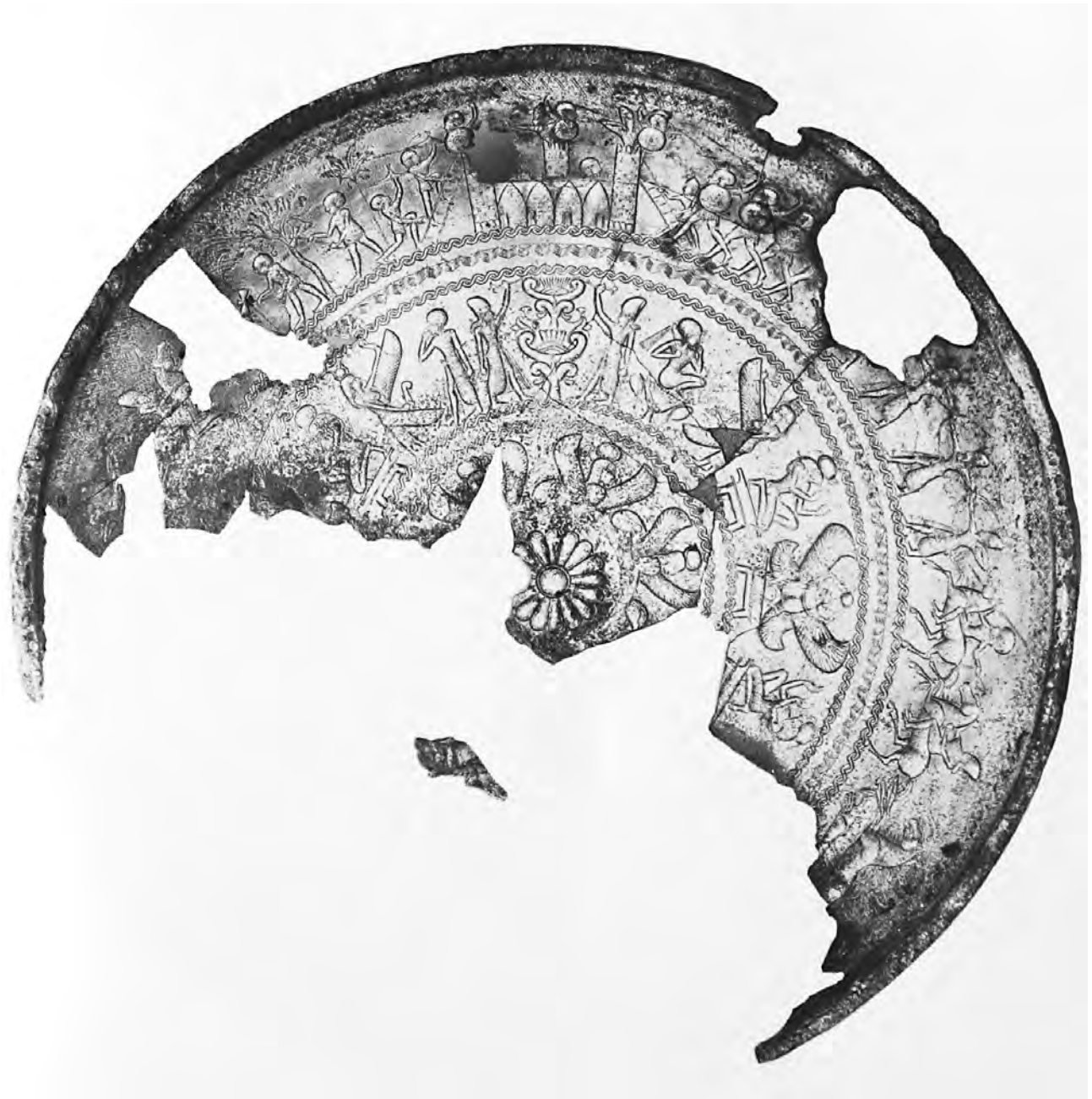
Fig. 3 — Coupe en argent d'Amathonte, Londres B.M. 123053, d'après Hermary 1986, p. 181, fig. 127.

d'argent d'Amathonte (fig. 3) où l'espace immédiatement à gauche de la ville est occupé par une scène d'abattage d'arbres (dont un palmier). Intrusion d'une scène agricole, quotidienne, dans une narration guerrière? On peut aussi penser que la scène participe du récit principal : on coupe des arbres pour construire des échelles de siège ou, mieux, on saccage un bosquet sacré 1 . Toujours est-il qu'il s'agit d'une nature domestiquée, entretenue, exploitée. Sur la coupe en bronze du Metropolitan Museum, la palmeraie est représentée du côté opposé de la ville, une procession part de cette dernière, une autre part de la palmeraie et