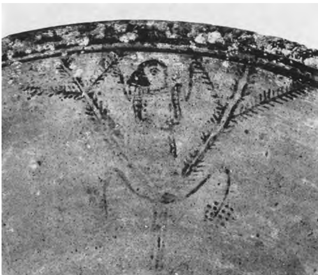
Fig. 5a-b — Bol de Kandou Musée de Chypre, CM 1973/VII-10/11. D'après Karageorghis, Des Gagniers 1979, p. 20-21.

fantastiques, des sphinx, symboles de la grande déesse de l'île. Cette nature s'oppose à celle de la terre lointaine, montagneuse, sauvage, dont la végétation est faite de résineux et la faune de bêtes à cornes, fauves et êtres fantastiques et menaçants : c'est le domaine de la chasse et de l'exploit héroïque. Les trois espaces (ville — nature proche — nature sauvage) ne sont cependant pas hermétiquement séparés. C'est ce que montrent les représentations narratives que portent les coupes métalliques : des processions les traversent et les relient, à pied, en cheval ou en char. C'est, me semble-t-il, une façon de rendre compte, en images, de la totalité de l'espace des royaumes 1 .