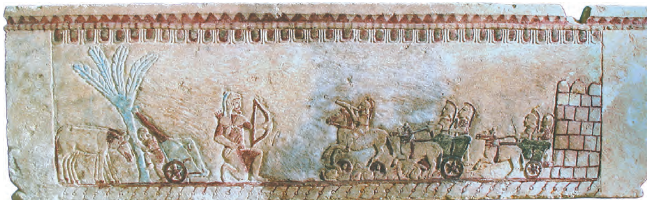
Fig. 4 — Sarcophage de Palaepaphos-Kato Alonia. D'après Florentzos 2007, page de couverture.

religieux ne fait pas de doute. Il est tentant d'interpréter cette image comme une représentation de hieros kêpos ou d' alsos , d'un jardin ou d'un bosquet sacré. On sait, d'après Strabon (XIV, 6) que des processions se rendaient chaque année depuis la ville nouvelle de Paphos jusqu'au sanctuaire d'Aphrodite de Palaepaphos. Des haltes sur cette route ont peut-être marqué la toponymie locale moderne : un village actuel porte le nom de Geroskipou. Certes, cet exemple est plus récent et la procession est liée au déplacement de la ville de l'Ancienne à la Nouvelle-Paphos. Mais rien ne s'oppose à ce que des « Jardins Sacrés » aient existé auparavant, et qu'ils aient constitué, alors, le but des processions partant de l'Ancienne-Paphos 1 .