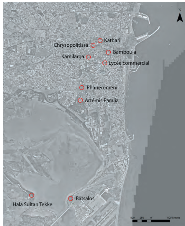
Fig. 7 — Kition, localisation des sanctuaires. Carte tirée du SIG de la mission française de Kition et Salamine, A. Rabot.

L'une des manifestations les plus remarquables de ce phénomène touche la zone du lac salé, au sud de la ville. Plusieurs sanctuaires sont, en effet, implantés sur les rives du lac, sur son pourtour oriental. Le matériel n'en est que partiellement connu, mais il date majoritairement de l'époque classique, qui signale le moment le plus intensif de la fréquentation. Le premier sanctuaire en sortant de la ville 5 est consacré à une divinité féminine vénérée, à l'époque