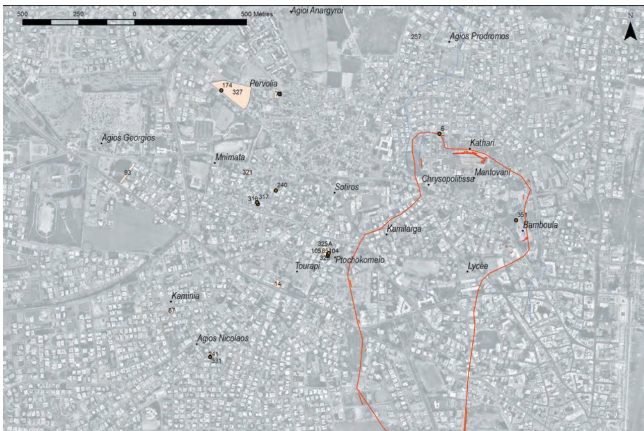
Fig. 2 — Kition, localisation des tombes géométriques. Carte tirée du SIG de la mission française de Kition et Salamine, A. Rabot.

archéologique du terme) datant de l'âge du fer : on aurait l'emprise de la ville, ceinte d'une muraille. En l'occurrence, le tracé supposé de cette muraille ferait le tour d'une cuvette, les niveaux situés à l'extérieur du rempart étant systématiquement plus hauts que ceux supposément intra muros ... Un sondage ponctuel sur le plateau de Marchello , où avait été dégagée une portion du rempart, a d'ailleurs montré que ce dernier ne se poursuivait pas vers le site du sanctuaire principal, mais qu'il faisait retour, délimitant probablement une citadelle (avec un palais ?).