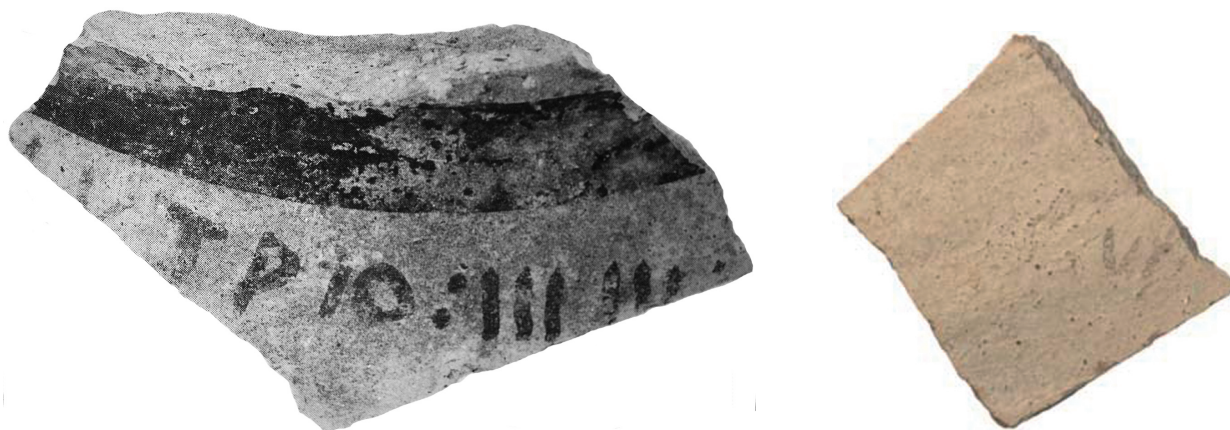
Fig. 3. Inscriptions peintes provenant d'un contexte palatial a. Inscription n° 7. b. Inscription n° 8.

Les inscriptions sont peintes en noir, plus rarement en rouge, sur des vases fermés. Leur emplacement, le plus souvent sur l'épaule, dans la zone de plus grand diamètre, les met bien en évidence. Trois écritures sont employées : le syllabaire (attesté dans tous les contextes), l'alphabet grec (uniquement au palais) et l'alphabet phénicien (dans le sanctuaire d'Aphrodite et les nécropoles). Elles transcrivent trois langues différentes. Même si les textes phéniciens ne sont pas compréhensibles, la préposition d'appartenance L qui ouvre l'inscription du pithos n° 5 (fig. 2) et peut-être celle de l'amphorisque n° 1 prouvent qu'ils sont bien rédigés en phénicien. Aucune des inscriptions syllabiques n'est interprétable par le grec, ce qui invite à considérer qu'il s'agit de textes "étéochypriotes". La séquence a-na , sur la cruche n° 3, que l'on retrouve aussi sur le "vase d'Amathonte" au