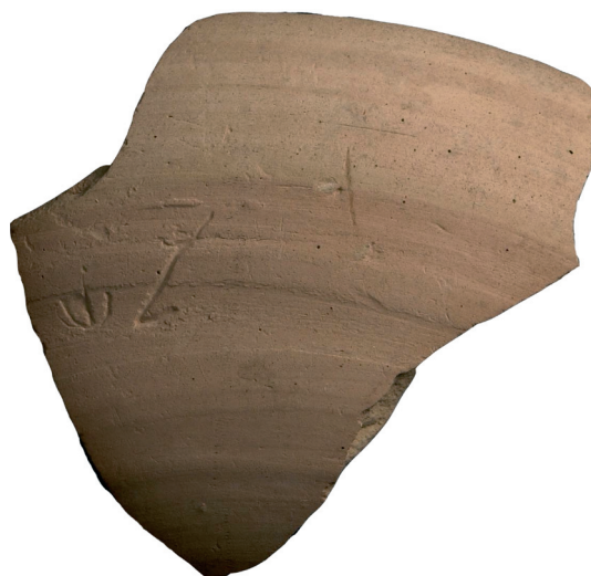
Fig. 4. Inscription n° 21.

25. Dépôt du rempart nord. Contexte de la fin de l'époque archaïque. Fond d'amphore à anses de panier (inv. d / ins. 1), portant 2 signes syllabiques : so-ke (?), en lecture sinistrotroverse, le vase étant posé à l'endroit 43 (fig. 5a).