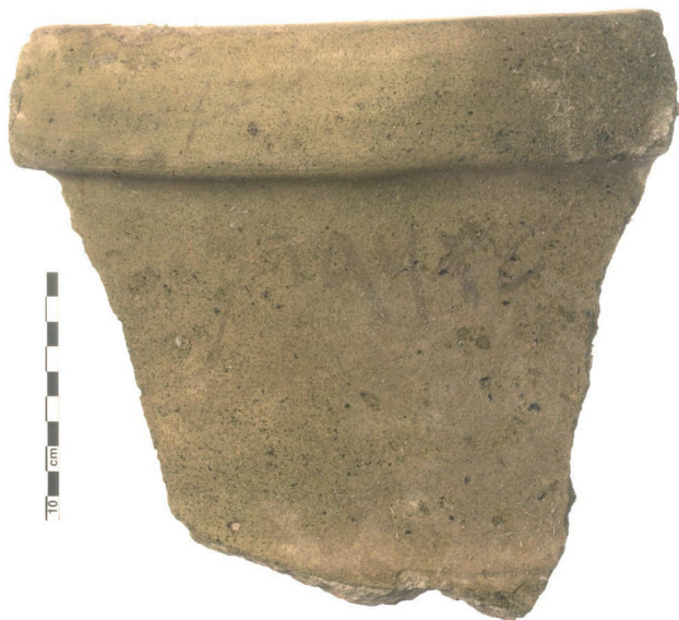
Fig. 2. Inscription n° 5.