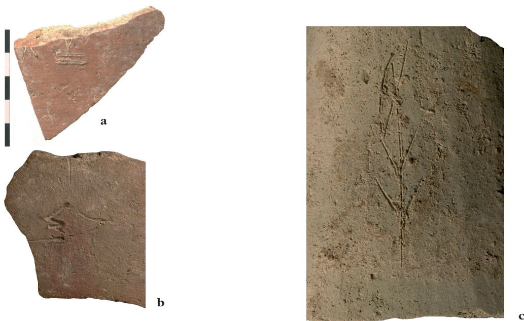
Fig. 5. Inscriptions incisées avant cuisson provenant d'un contexte palatial a. Inscription n° 25. b. Inscription n° 26. c. Inscription n° 27.

31. Terrasse ouest. Contexte de la fin de l'époque archaïque. Bord de bol Plain White (conservé à Limassol ou à Nicosie ?). Inscription syllabique sinistroverse : ma (?) 50 (fig. 6c).