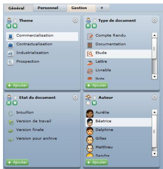
Figure 1. Présentation de l'interface du SOC à Facettes

Notre approche de la classification à facettes est largement contextuelle, elle vise plutôt l'adaptation de principes de création de classification à facettes à chaque entreprise et n'a pas de visée universelle. L'outil en cours de développement permet de taguer des documents au fil de l'eau, lors de leur création ou ultérieurement, en rassemblant les tags dans une structure à facettes.