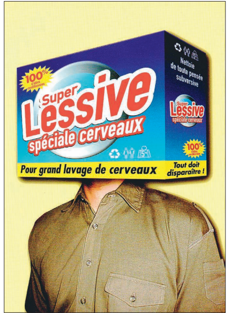
Figure 4. « Super lessive », Casseurs de pub © 1999, p. 40