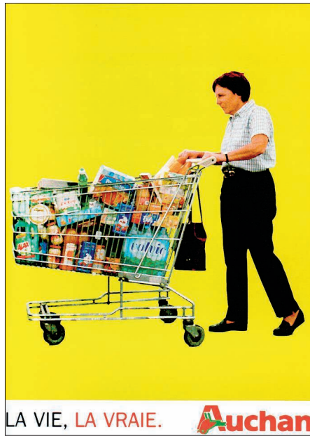
Figure 1. « Auchan », Casseurs de pub © 2002, p. 15