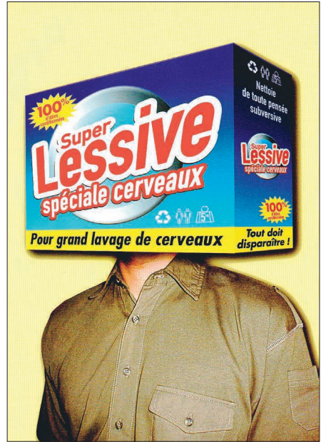
Figure 4. « Super lessive », Casseurs de pub © 1999, p. 40