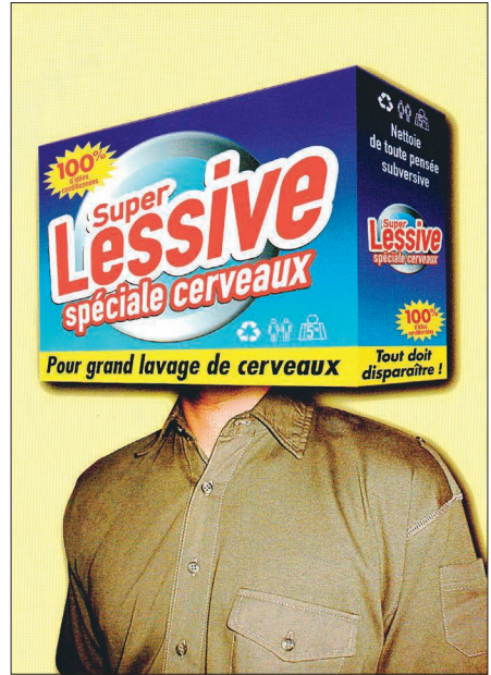
Figure 4. « Super lessive », Casseurs de pub © 1999, p. 40