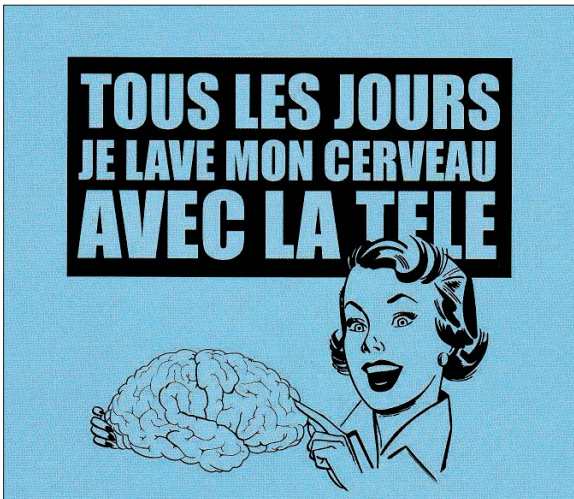
Figure 5. « Tous les jours, je lave mon cerveau avec la télé », Casseurs de pub © 2002, p. 45