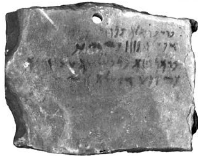
Figure 32. Inv. 1880/7-10/44 = BM 125.081.