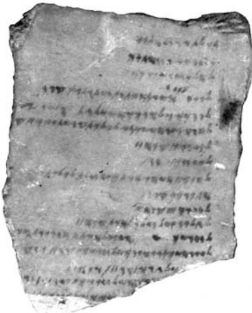
Figure 31. Inv. 1880/7-10/43 = BM 125.080. Face A.

Il reste enfin à mentionner quatre coquillages 136 qui devaient appartenir au sédiment naturel (ils sont nombreux dans le sol de cette zone qui était, dans l'Antiquité, ouverte sur la mer).