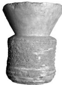
Figure 28. Cat. 23 = 1880/7-10/28.