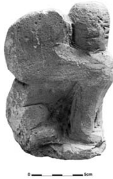
Figure 21. Cat. 16 = 1880/7-10/49.