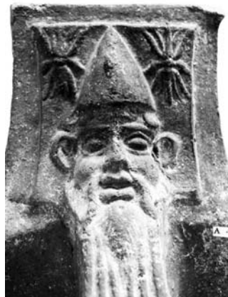
Figure 7. Cat. 3 = 1880/7-10/36 (détail).