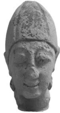
Figure 19. Cat. 14 = 1880/7-10/46.