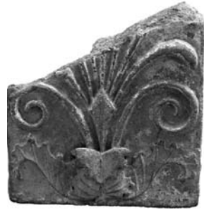
Figure 15. Cat. 10 = 1880/7-10/42.