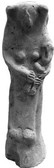
Figure 13. Cat. 8 = 1880/7-10/32.