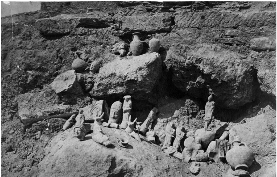
Figure 5. Photographie prise en 1879 sur le site de Bamboula.

La petite collection d'antiquités mise au jour lors des travaux britanniques de 1879 et arrivée au British Museum en 1880 par l'intermédiaire du comte Granville comporte des objets de types divers, datables du Bronze Récent à l'époque romaine. Les rapports publiés du lieutenant Sinclair et de M. Ohnefalsch-Richter 53 ne permettent pas de déterminer leur contexte précis de découverte. Il n'est évidemment pas question de proposer une étude contextuelle d'un échantillon aussi réduit et dont la collecte fut pour le moins aléatoire. Mais, alors que la publication française du sanctuaire est sous presse 54 , il a paru intéressant de faire mieux connaître ce petit lot de trouvailles, certaines déjà bien publiées, d'autres inédites, et de le replacer dans le cadre des découvertes faites sur le site au cours des fouilles stratigraphiques des missions suédoise puis française.