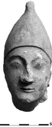
Figure 18. Cat. 13 = 1880/7-10/47.