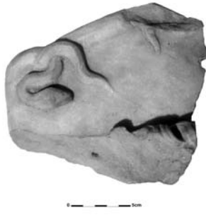
Figure 24. Cat. 19 = 1880/7-10/25.