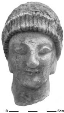
Figure 20. Cat. 15 = 1880/7-10/48.