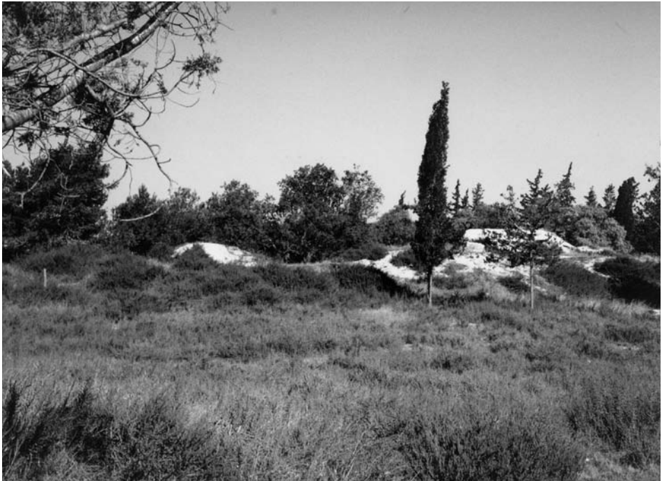
Figure 3. The hill of Bamboula, beginning of the French excavations 1976 (Mission française de Kition et Salamine).

depending on the interests and initiative of local officials such as Cobham, Sinclair and Warren (and with the encouragement of Newton), and all private excavations were banned by the High Commissioner Sir Garnet Wolsey. Yet no arrangements were made to establish even a rudimentary archaeological service in the new territory, much less a museum in which to store casual archaeological finds. It would take four years, and an essentially private initiative (though involving numerous public officials) before the establishment of the Cyprus Museum in 1882. 24