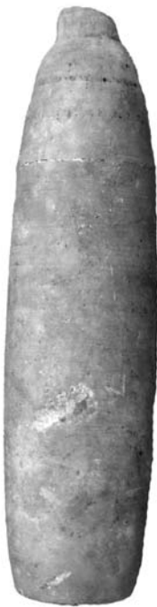
Figure 26. Cat. 21 = 1880/7-10/26.

et écailles) se retrouve sur des vases de pierre tendre de fabrication chypriote 122 . Les modèles de baignoires sont un mobilier généralement funéraire : si notre objet provient bien de Bamboula , il indique la présence de tombes du Bronze Récent dans la zone. Or, les fouilles françaises ont justement mis au jour, dans un sondage très limité au nord de la colline, un abondant matériel qui provient selon toute vraisemblance d'une ou plusieurs tombes pillées du Bronze Récent 123 . Les vases d'albâtre local (en réalité du gypse, une pierre très abondante dans la région de Larnaca) 124 appartiennent, eux, au premier millénaire, même si leur datation précise est difficile.