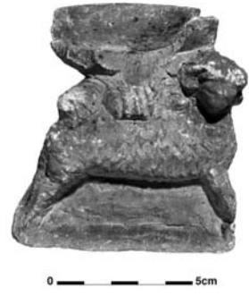
Figure 22. Cat. 17 = 1880/7-10/50.

Les statuette de sphinx appartiennent généralement à des brûle-parfums, la vasque étant soutenue par la tête et/ou les ailes de l'animal fantastique 106 . Ce n'est pas le cas de notre exemple. Les statuette libres de sphinx sont rares : deux beaux exemple funéraires de Marion sont conservés au Musée du Louvre 107 ; deux sphinx couchés, coiffés de la double couronne égyptienne et formant un groupe avec quatre lions, ont été découverts