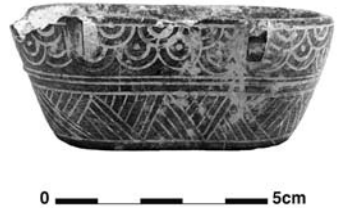
Figure 25. Cat. 20 = 1880/7-10/52.

Les fouilles suédoises et françaises de Bamboula ont mis au jour de nombreux autels, de types divers, depuis les niveaux du Chypro-Géométrique III (IX e s. av. J.-C.) jusqu'à ceux de la fin de la période classique (fin du IV e s. av. J.-C.). Ces autels entrent dans deux catégories principales, souvent associées dans un même aménagement cultuel : les autels bas (foyers, plates-formes ou simples blocs posés à plat sur le sol), et les autels hauts, catégorie à laquelle on peut rattacher l'exemple miniature du British Museum 116 . Il peut s'agir, là encore, de simples blocs fichés verticalement dans le sol, ou de petits monuments plus élaborés. Ainsi, le premier autel géométrique est un bloc de grès évidé en cuvette dans sa partie supérieure, très semblable à des autels du Bronze Récent (par exemple ceux du sanctuaire du Dieu au Lingot d'Enkomi). Celui du IV e siècle est un beau