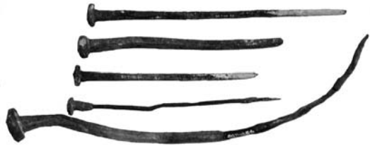
Figure 30. Cat. 25 = 1880/7-10/54, 55, 56, 57, 59.