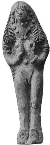
Figure 10. Figurine A 91 = 1880/7-10/29 (d'après Walters 1903, pl. II).