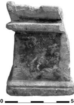
Figure 23. Cat. 18 = 1880/7-10/51.

18. Inv. 1880/7-10/51 (Fig. 23). H. 7,8 ; L 6,9 ; l. 5,9. Autel rectangulaire en calcaire, une moulure à la base, deux au sommet, partie supérieure en cuvette. Restes de peinture bleue et rouge conservés au niveau des moulures. Cassé sur un côté. III e -II e s. av. J.-C. ?