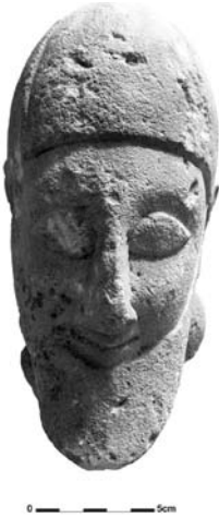
Figure 17. Cat. 12 = 1880/7-10/45.