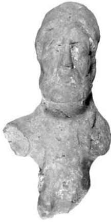
Figure 14. Cat. 9 = 1880/7-10/34.