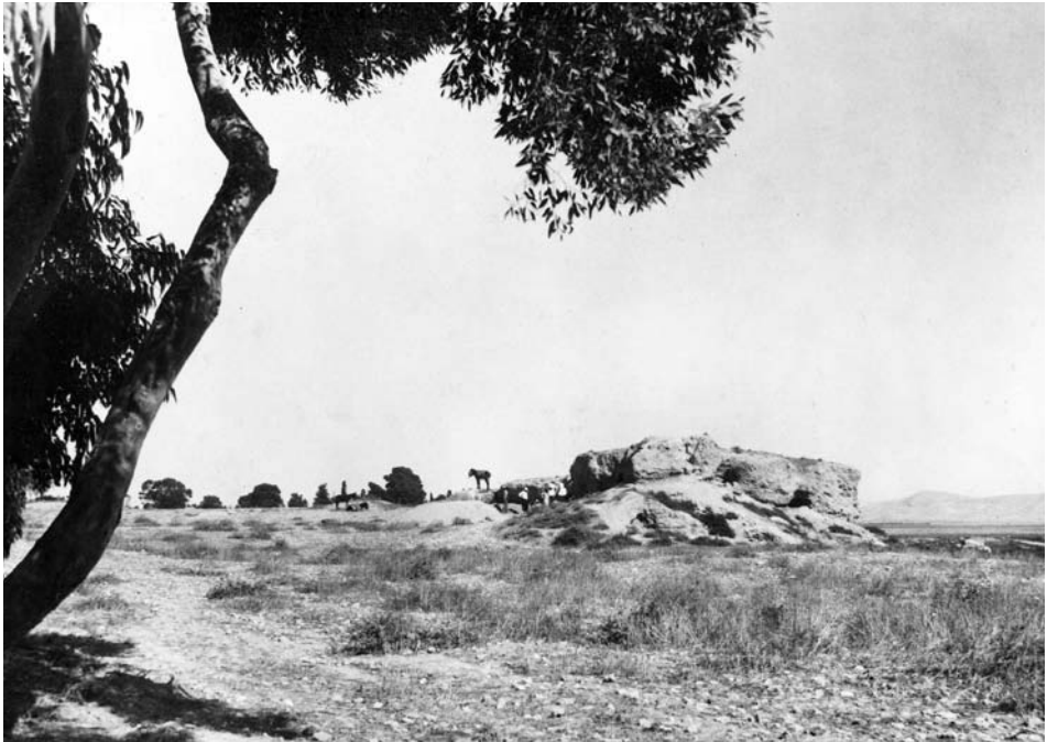
Figure 2. The hill of Bamboula, beginning of the Swedish excavations 1929.

damage was catastrophic, as up to a half of the original mound was destroyed. This is clearly visible in the images published by Ohnefalsch-Richter, 21 though the destruction continued afterwards if we compare these images with, successively, the photograph of the Bamboula taken by Myres in 1913, 22 by the Swedes in 1929 ( Fig. 2 ), and finally by the French in 1976 ( Fig. 3 ). The disaster was compounded by the lack of proper archaeological recording of the discoveries. The minimal surviving records of the work are both inadequate by modern standards, but also difficult to reconcile either with each other or with the archaeological topography of the area as revealed by modern fieldwork (see below).