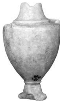
Figure 27. Cat. 22 = 1880/7-10/27.