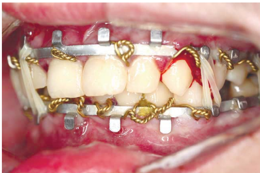
Рис. 3. Хворий 3. 13 років із травматичним переломом нижньої щелепи, вивихом 35, 44 зубів. Міжщелепне шинування за допомогою шин Васильєва

Впроваджений вивих ТЗ та ПЗ відмічався у 32 дітей, які отримували лікування в клініці кафедри хірургічної стоматології та щелепно-лицевої хірургії дитячого віку НМУ ім. О.О. Богомольця, що становило 15% випадків.