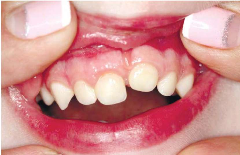
Рис. 6. Дівчинка П. 5 років, яка в 1,5 років отримала впроваджений вивих 61 зуба. Протягом трьох років 61 зуб поступово «прорізувався» і до сьогоднішнього часу досяг 2/3 висоти коронки

Лікувальна тактика щодо ПЗ у разі такого виду травми полягала в репозиції зуба та фіксації його згідно зі стандартним протоколом. В якості фіксуючих пристроїв використовували гладку шину-скобу (у 81% випадків) чи одномоментно виготовлену шину-каппу (рис. 7). Зазвичай знімали їх через два-три тижні. Протягом цього часу особливу увагу приділяли гігієні порожнини рота, а також проведенню протизапальної