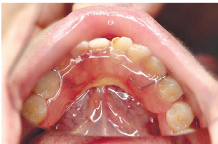
Рис. 9. Хлопець Б. 14 р. після травматичного видалення 41, 42 зубів, якому був виготовлений частковий знімний протез на нижню щелепу, що дало змогу профілакувати формування вторинних деформацій фронтального відділу нижньої щелепи

заміщали знімним протезом (рис. 9). Ефективність цього виду лікування становила 60% позитивного результату. Це зумовлено як особливостями проведення реплантації, підготовки зуба, спостереженням за ним, фіксацією, так і організаційними проблемами.