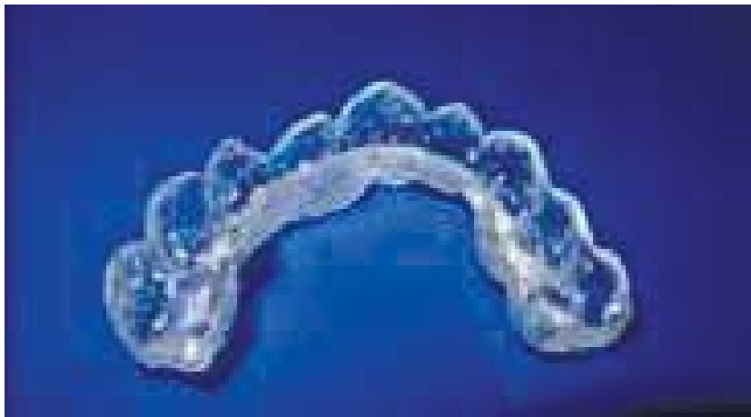
Рис. 7. Шина-каппа для фіксації вивихів зубів у дітей

терапії. Далі таку дитину спостерігав ортодонт, для попередження зубо-щелепних деформацій, та терапевт-стоматолог, який до 3-х місяців - кожний місяць, потім раз на 3 місяці, проводив ЕОД травмованого зуба для виявлення змін у пульпі або періодонті. Якщо в динаміці показники ЕОД зуба свідчили про загибель пульпи, то проводили його ендодонтичне лікування.