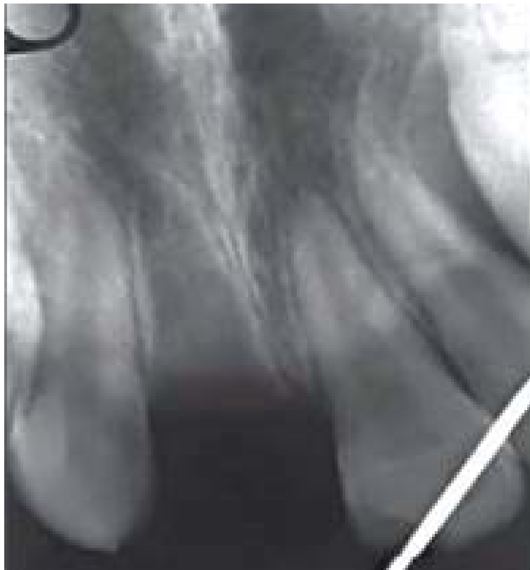
Рис. 8. Дитина К. 7 років з повним вивихом 11 зуба та прицільна рентгенографія травмованого зуба

тологів). На наш погляд, оптимальним і найдешевшим є утримання зуба в пакеті з 0,9% розчином NaCl, який бажано занурити в лід.