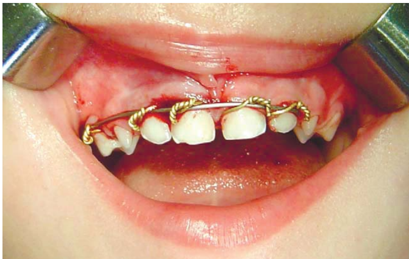
Рис. 1. Дитина 4 років з неповним вивихом 51, 52 зубів до та після фіксації їх за допомогою шини-скоби

норми (2-6 мкА) лише до моменту повного формування коренів (3). ЕОД травмованого зуба проводили через 1 міс., 3 міс. та 6 міс. після травми. Якщо в динаміці даних ЕОД виявлялося збільшення показників, що свідчило про загибель пульпи, то проводили ендодонтичне лікування. Через місяць після травми знімали фіксуючий пристрій і спостерігали дитину на диспансерному обліку.