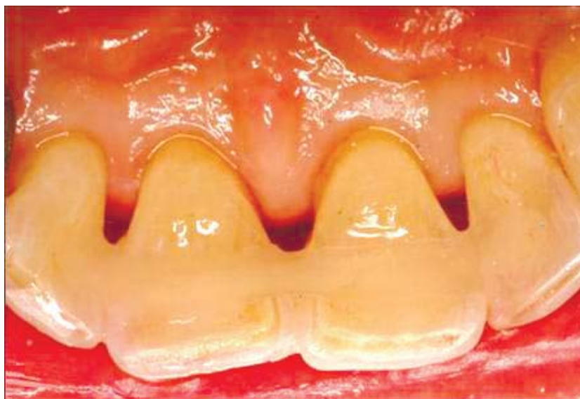
Рис. 2. Фіксація неповного вивиху 11, 21 зубів за допомогою сплінт-системи

розташовані 2-3 зуби. У декількох випадках – у 3-х дітей (2,4%), у постійному прикусі зуб був зафіксований брекет-системою, бо вони отримували ортодонтичне лікування. При всіх видах іммобілізації травмований зуб не виводили з оклюзії, що призводило до перенавантаження тканин періодонта та, в подальшому, до часткового лізису кореня.