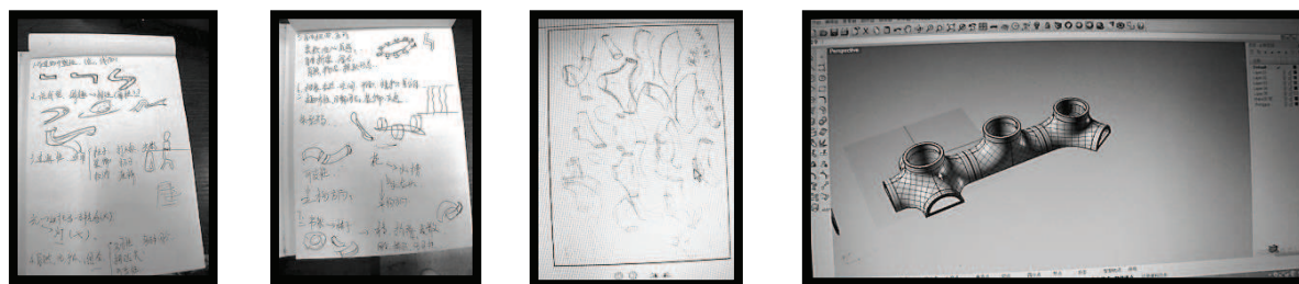
Figure 3 Exemples de représentations réalisées par le groupe de GXL pour un pot de fleur modulaire (dessins sur papier et scannés et modèle 3D réalisé par un autre étudiant).

Les activités collaboratives de la conception : comment introduire le travail d'équipe dans l'enseignement du design ?