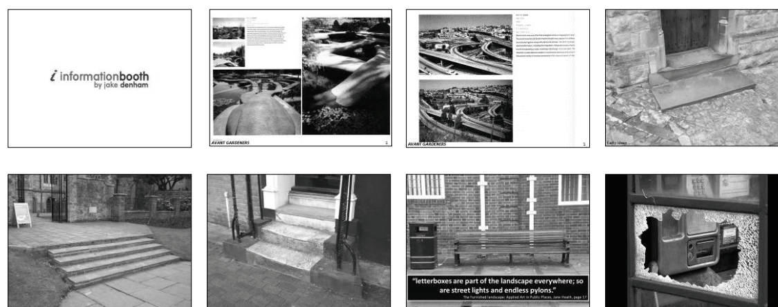
Figure 2 Les diapositives réalisées par JD et la « rupture », après la septième.

Dans le même temps, JBB, un des étudiants de l'ESADSE précise (les extraits directs de ses déclarations sont en casse normale et traduits en français avec l' « original » anglais à proximité) :