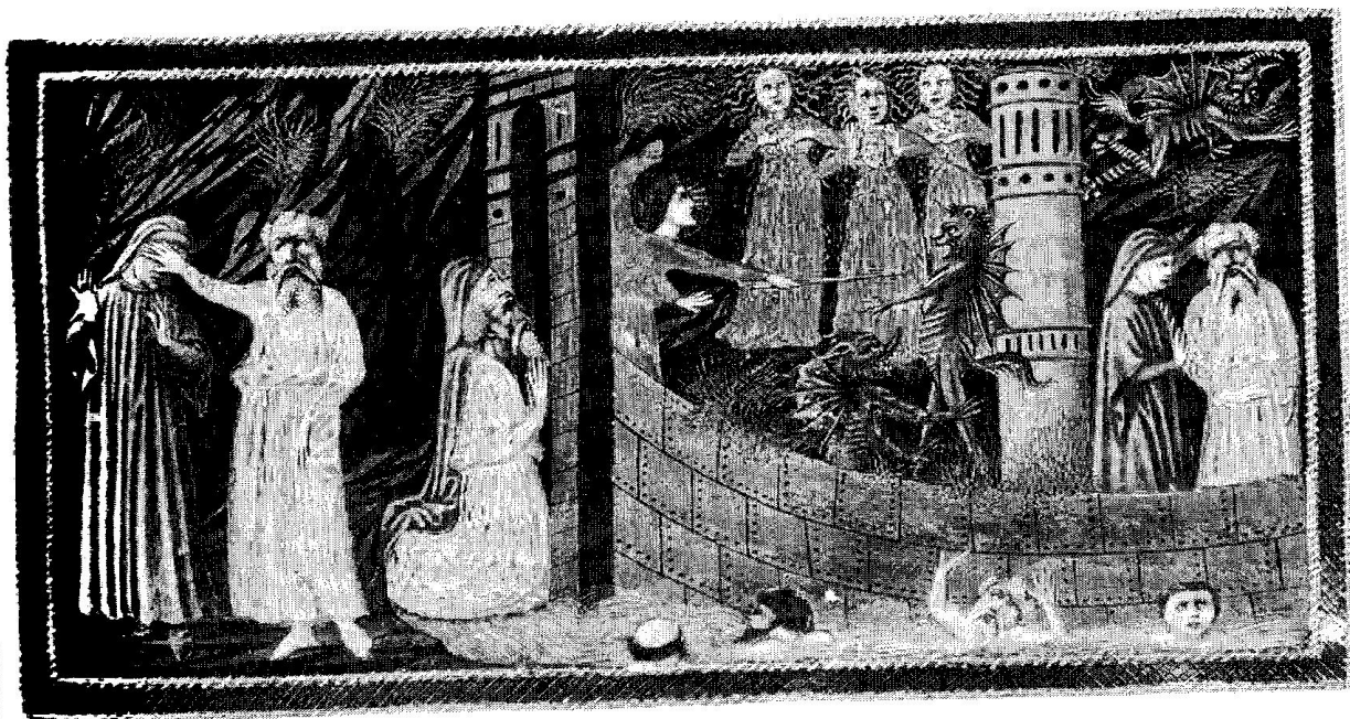
Fig. 2. Detalle: Divina Comedia , Priamo Della Quercia, entre 1444 y 1452. Inferno, Canto IX, 70: Dante con Virgilio ante la entrada de la ciudad de Dis. Dentro: demonios y furias. Nótese, así como el miniaturista aislaba las escenas mediante estructuras arquitectónicas o elementos decorativos, el lector también debía hacerlo en su mente, separando los fotogramas y estructurándolos en orden. El texto es el que empujaba a ambos a hacerlo. British Library, Yates Thompson 36, f.16r.

Cabe añadir, antes de terminar, que en este caso la nomenclatura parece una carga trivial e innecesaria. ¿Para qué hablar de mnemonic criticism o mnemonic studies si en realidad de lo que estamos hablando es de situar las obras en su contexto y analizarlas considerando las prácticas antropológicas en las que fueron creadas, copiadas, leídas y transmitidas? Este proceso de etiquetaje de la crítica literaria comporta un riesgo ex-