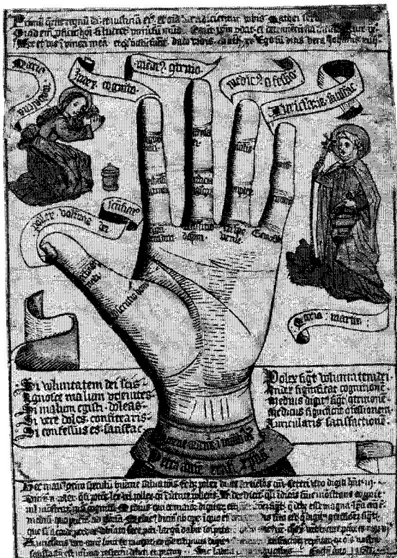
Fig. 3. La mano como espejo de salvación, 1466. Grabado sobre madera. Un diseño que se remonta a la mano guidoniana, un mecanismo mnemónico utilizado para el canto. La mano se fragmenta en loci , con imágenes o palabras inscritas que ayudan a recordar conocimientos precisos. En este caso, se trata de un aprendizaje moral. National Gallery of Art, Washington.

No es fácil, ni lo será, diferenciar entre figuras retóricas, imágenes de memoria y diagramas. Se trata de fronteras líquidas de difícil trazado, de huesos esparcidos cuyos esqueletos es casi imposible recomponer. Solo mediante una hermenéutica precisa y rigurosa se podrá desempolvar y reconocer los mecanismos retóricos del texto. Como Simónides, hay que persistir e identificar los cuerpos. Desafortunadamente, como él también, seguiremos esperando la otra mitad de la paga —si no toda—.