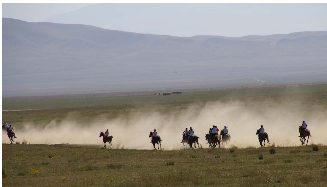
Fig. 5 a & b (page suivante) Bäjge "course de longue distance". région d'Almaty, Kazakhstan, août 2013

Cette hypothèse ne vient pas de ces seules descriptions, mais également de l'examen des courses hippiques de longue distance, telles qu'elles sont pratiquées en Asie centrale et encore aujourd'hui au Kazakhstan et au Kirghizstan. Les courses de chevaux traditionnelles, communément appelées kaz. bäjge , kir. bajge , prennent place dans des festivités souvent grandioses et plus particulièrement dans les fêtes funéraires qui, d'après les sources historiques et ethnographiques, étaient originellement leur unique destination (Grodekov 1889, p. 253; Simakov 1984, p. 196).