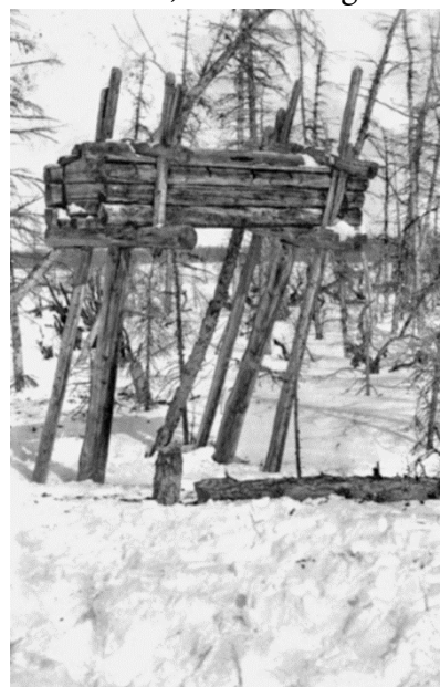
Fig. 2 Arañas iakoute, estrade funéraire Photographie de la collection Jochelson, fin XIX e siècle

Les sépultures sur estrades, dites arañas , sont une spécificité iakoute que la colonisation russe fit disparaître, la remplaçant définitivement par l'ensevelissement. Ces estrades en bois permettent la décomposition des chairs tout en laissant les os intacts, dont l'intégrité est nécessaire à toute résurrection (Roux 1963, p. 139; Hamayon 1990, p. 397 et passim ). Les corps étaient mis sur l' arañas au printemps ou en été, avec de la vaisselle, de la nourriture et des armes. La peau d'un cheval sacrifié était suspendue à côté de la tombe. Si la mort était survenue en hiver, le défunt attendait sa sépulture dans sa maison, quittée par les autres occupants (Lindenau 1983, p. 40; Hudâkov KOVO , p. 296-297; Kočnev 1894, p. 455-456). Ces arañas persistèrent jusqu'au milieu du XVIII e siècle pour les chamanes, qui bénéficiaient, en outre, de funérailles répétées, accompagnées de sacrifices équins répétés (Novgorodov 1955, p. 155-158; Èrgis & Popov 1960, II, p. 255-257; Alekseev 1980, p. 184).