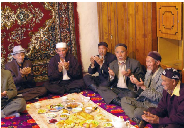
Fig. 9 Parents du défunt réunis dans sa maison la veille de l' as . Kazakhstan méridional, avril 2008

p.248 une obligation impérieuse pour cette fête funéraire. Le défunt avait l'habitude de se déplacer sur un âne, mais à la différence du cheval, cet animal n'est jamais consommé. La famille ne possédait pas de chevaux, ses membres ont donc décidé d'en acheter un pour l'occasion. Ils en ont fait l'acquisition au marché au bétail, l'ont abattu dès le lendemain, par égorgement suivant la règle générale et ont apporté sa viande au restaurant où s'est déroulé cet as , qui a réuni environ 150 personnes. Ils auraient pu se contenter d'acheter de la viande de cheval pour le banquet, ce qui aurait été bien plus avantageux, car une demi-carcasse aurait suffi, mais il convient, dans ces occasions, de «faire les choses comme il faut». Et que dire alors de ceux qui proposent de la viande bovine pour un as ! Cette action ne suscite que du mépris, exprimé sous la forme de cette réflexion : «il a envoyé son père [dans l'autre monde] sur une vache» 12 , qui révèle l'amalgame des deux fonctions, culinaire et psychopompe.