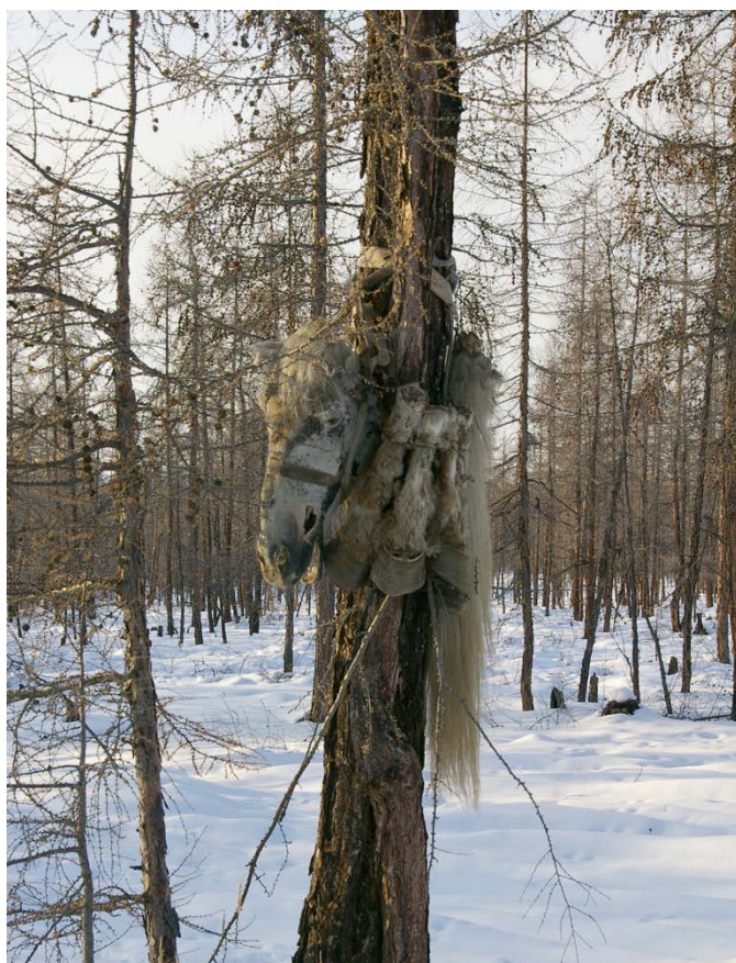
Fig. 7 Tête, extrémités et queue d'un cheval suspendues à un arbre à proximité d'un cimetière Ph. C. Ferret, ulus de Verhoânsk, Iakoutie, mars 2011

Encore de nos jours, on voit parfois, près de certains cimetières de Iakoutie septentrionale, notamment dans les ulus de Srednekolymsk et de Verhoânsk, une tête et des membres chevalins suspendus à un arbre, non loin des tombes. En effet, il est toujours d'usage, lorsque décèdent certaines personnes âgées, de tuer leur cheval favori ou celui qu'elles ont préalablement désigné, et de le manger à leurs funérailles 10 .