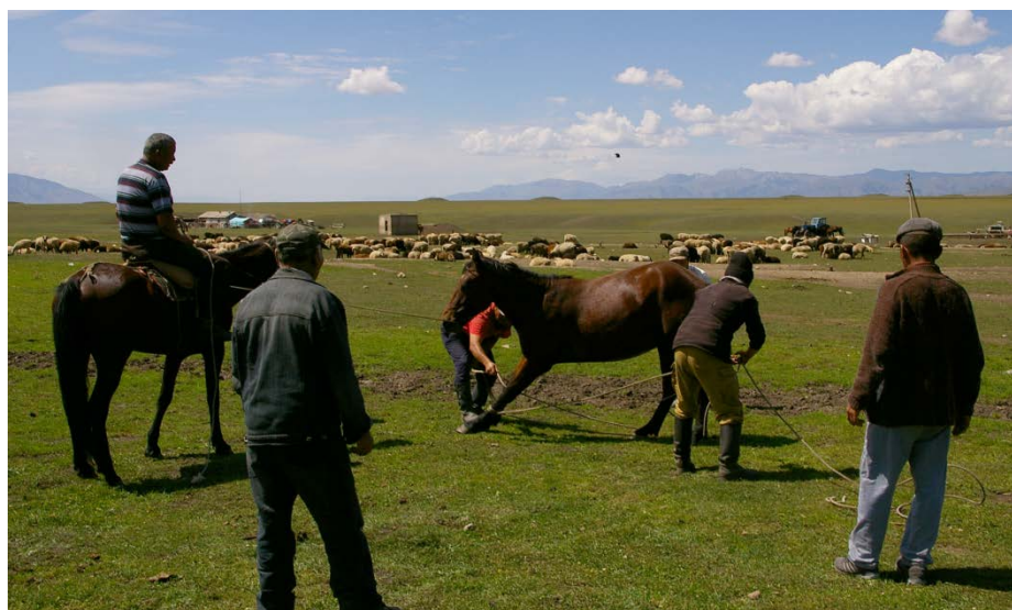
région d'Almaty, Kazakhstan, août 2013