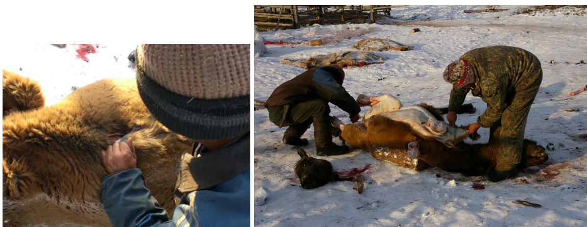
Fig. 4 Abattage de chevaux iakoutes

4a. Incision permettant l'arrachage de l'aorte.