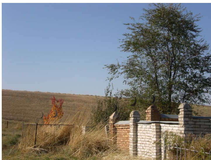
Fig. 10 Cimetières kazakhs. a. Kazakhstan méridional, octobre 2009 ; b. (page suivante) région d'Almaty, Kazakhstan, juin 2012