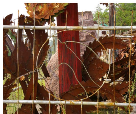
Fig. 6 a & b. Tombe d'A. I. Artamonov, gardien de troupeaux de chevaux, héros de l'époque soviétique. Avec à droite, un détail de la tête de cheval ornant la clôture de sa tombe. Ulus d'Ust'-Aldan, Yakoutie, juillet 2008.