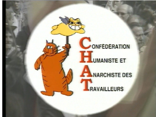
Fig. N° 4 : Capture d'écran : « Avait-il des ambitions politiques ? »

Travailleurs » se juxtapose aux représentations des chats. Ce plan est ensuite suivi de la deuxième interrogation suivante, qui clôt le chapitre sur le « 21 avril 2002 » : « Ou se contentait-il d'affirmer, partout, son sourire ? ».