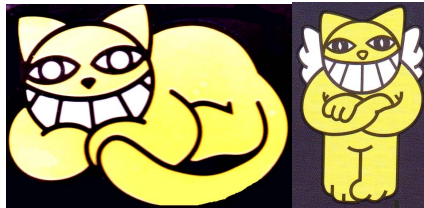
Fig. N° 3 : « Le Chat de la liberté »

Dans Chats Perchés , Chris Marker court après les chats entre septembre 2001 et le printemps 2003. Entre les images de chats et celles de Parisiens musiciens, voyageurs, SDF, usagers du métro, des événements politiques ponctuent le film : on traite de la campagne présidentielle française de 2002 (Texte à l'écran : « Le 21 avril, catastrophe. » Image d'un chat avec un pansement à la patte. « Le chat Boléro s'est pris la patte dans l'escalator »), du débat sur le voile islamique, de la guerre en Irak, de la crise des intermittents du spectacle... Marker multiplie les clins d'œil engagés dénonçant implicitement les malaises de notre société ceci à l'aide de ce compagnon félin qui apparaît et disparaît au gré des occasions. Chats perchés est un discours sémiotique complexe et original qui mêle tous les matériaux : la vidéo, qui est le moyen privilégié de cette exploration ; le « morpheye », qui déforme et ralentit légèrement l'image tout en la rendant picturale ; les intertitres en blanc sur fond noir, par lesquels le cinéaste s'exprime. Marker aime le montage, le découpage, le recadrage, la superposition de sons (métro), musiques (alternance piano au son ancien et musiques intrigantes), discours audio (radio) et vidéo (film, discours télévisuel).