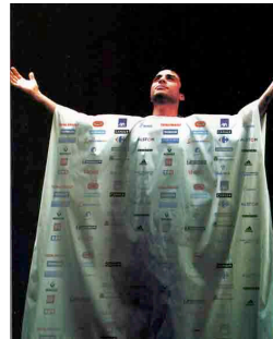
Figure 14 et 15 : Moralisation assimilée au culte religieux

Méthodologiquement, cette manière de faire est pour nous une démarche opératoire cherchant à distinguer les différentes origines des mécanismes. Cependant, en réalité, il est très difficile d'isoler ces différents déterminismes. Tout s'entremêle, on cherche seulement à y voir un peu plus clair. Dans le cas du comique de répétition des Casseurs de pub , les mécanismes essentiels susceptibles d'influencer le lecteur sont : la métaphore, l'appel à la mémoire collective inévitable et l'orientation axiologique. La métaphore humoristique axiologique est la technique favorite des Casseurs de pub . Grâce à l'intradiscours, cette technique participe solidement à la visée persuasive du discours. Comme nous le dit Marc Bonhomme, « métaphoriser, c'est non seulement activer des propriétés analogiques, mais c'est orienter qualitativement le discours, suggérer des évaluations et chercher à les imposer. » (2005, p. 222). Le comique de répétition activé dans le contre-discours publicitaire peut donc se définir par sa propriété métaphorique et sa facette axiologique, caractéristiques participant à la visée persuasive.