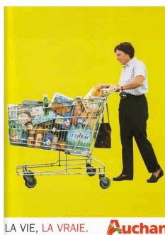
Figure 7 : Fausse publicité