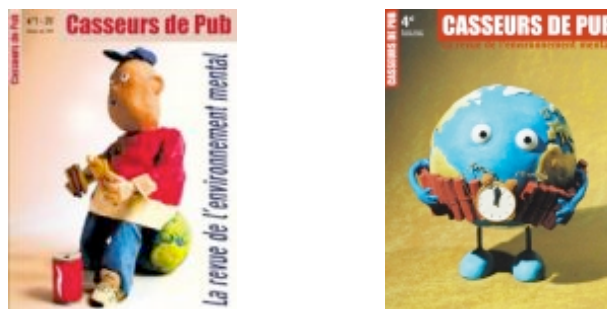
Figures 1 et 2 : La pâte à modeler, identité « plastique » des Casseurs de pub

Les mécanismes dits « sémio-linguistiques » correspondent aux procédés qui mettent l'accent sur la relation signifiante, que ce soit une relation d'analogie (métaphore), du tout et de la partie (synecdoque), d'anaphore (répétition, parallélisme) ou encore de transgression (imitation, transformation). Au niveau de la matérialité discursive, il existe avant tout une redondance de deux techniques : la pâte à modeler d'une part, donnant une tonalité humoristique et faisant penser au dessin animé Wallace et Gromit et la bande dessinée comique d'autre part. Voici l'exemple de deux premières de couverture caractéristiques :