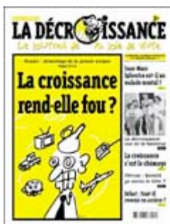
Figure 8 : Le stéréotype redondant de la folie

Pour interpréter le discours, le lecteur a besoin de connaissances encyclopédiques de base, de savoirs communément partagés. Le créateur du discours humoristique peut utiliser, pour éviter l'échec de l'interprétation, des savoirs très largement connus par Monsieur Tout-le-monde. C'est ce qui se passe dans les Casseurs de pub : on s'adresse à un public populaire et le mécanisme socio-linguistique ayant le plus d'impact est le stéréotype. Mélanger humour, stéréotypes et répétition de ceux-ci participe ainsi largement au succès du discours véhiculé, comme dans l'exemple ci-dessous, avec l'utilisation coutumière de l'entonnoir représentant la folie engendrée par la croissance.