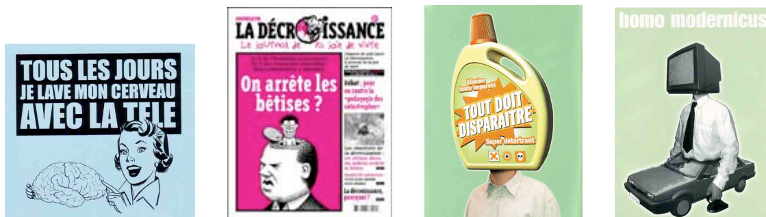
Figures 3, 4, 5 et 6 : Métaphores iconiques de la bêtise

Le mécanisme sémio-linguistique du comique de répétition le plus utilisé est la répétition de la métaphore iconique de la bêtise représentant la consommation. Dans la grande partie des discours iconiques, la tête des personnages représentés est remplacée pour signifier la bêtise de la consommation. On retrouve très souvent l'image du cerveau lobotomisé, de la tête vide ou encore de la tête remplacée soit par un produit issu de la consommation soit par la télévision.