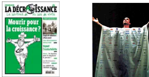
Figure 14 et 15 : Moralisation assimilée au culte religieux

Enfin, pour représenter le danger de l'idéologie de croissance, le discours alter-mondialiste s'appuie sur des valeurs moralisatrices. Précisément, l'humour ironique est utilisé pour comparer la société de consommation à une foi, un culte, une admiration religieuse. Dans les figures qui suivent, on représente le consommateur en martyr et dans la figure 15, la tenue du prêtre est recouverte de marques. Les métaphores du prêtre ou de la crucifixion deviennent ainsi représentatives, par leur répétition, du discours des Casseurs de pub - ce qui soulève un problème vis à vis de la légitimité du discours, question que nous abordons dans la partie qui suit.