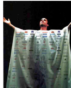
Figure 14 et 15 : Moralisation assimilée au culte religieux

Méthodologiquement, cette manière de faire est pour nous une démarche opératoire cherchant à distinguer les différentes origines des mécanismes. Cependant, en réalité, il est très difficile d'isoler ces différents déterminismes. Tout s'entremêle, on cherche seulement à y voir un peu plus clair. Dans le cas du comique de répétition des Casseurs de pub , les mécanismes essentiels susceptibles d'influencer le lecteur sont : la métaphore, l'appel à la mémoire collective inévitable et l'orientation axiologique. La métaphore humoristique axiologique est la technique favorite des Casseurs de pub . Grâce à l'intradiscours, cette technique participe solidement à la visée persuasive du discours. Comme nous le dit Marc Bonhomme, « métaphoriser, c'est non seulement activer des propriétés analogiques, mais c'est orienter qualitativement le discours, suggérer des évaluations et chercher à les imposer. » (2005, p. 222). Le comique de répétition activé dans le contre-discours publicitaire peut donc se définir par sa propriété métaphorique et sa facette axiologique, caractéristiques participant à la visée persuasive.