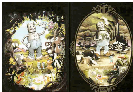
Figure 13 : Mélange de valeurs : Avant et Après

Pour prouver la mauvaise influence de la société de consommation sur la vie en général, les Casseurs de pub utilisent souvent un avant et un après , qui traduisent une transformation, comme dans la figure ci-dessous, confrontant de la sorte les « bonnes » et les « mauvaises » valeurs.