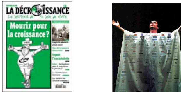
Figure 14 et 15 : Moralisation assimilée au culte religieux

Enfin, pour représenter le danger de l'idéologie de croissance, le discours alter-mondialiste s'appuie sur des valeurs moralisatrices. Précisément, l'humour ironique est utilisé pour comparer la société de consommation à une foi, un culte, une admiration religieuse. Dans les figures qui suivent, on représente le consommateur en martyr et dans la figure 15, la tenue du prêtre est recouverte de marques. Les métaphores du prêtre ou de la crucifixion deviennent ainsi représentatives, par leur répétition, du discours des Casseurs de pub - ce qui soulève un problème vis à vis de la légitimité du discours, question que nous abordons dans la partie qui suit.