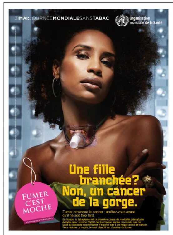
Figure 2. Stimulus de l'expérimentation.

Soumission du questionnaire pré-exposition. 450 étudiants ont répondu au questionnaire pré-exposition. Parmi eux, les fumeurs ont été répartis aléatoirement entre le groupe test et le groupe contrôle.