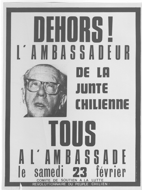
Illustration 1. Comité de soutien à la lutte révolutionnaire du peuple chilien.

Avec ses satellites d'Europe de l'Est et Cuba, l'Union soviétique fut finalement l'une des rares nations du monde à dénoncer durablement le coup d'État et marqua très symboliquement son refus de reconnaître le nouveau régime en boycottant le match de football Chili – URSS du 21 novembre 1973, comptant pour les éliminatoires de la coupe du Monde 1974, qui se déroula finalement avec la seule sélection chilienne sur le terrain dans l' Estadio