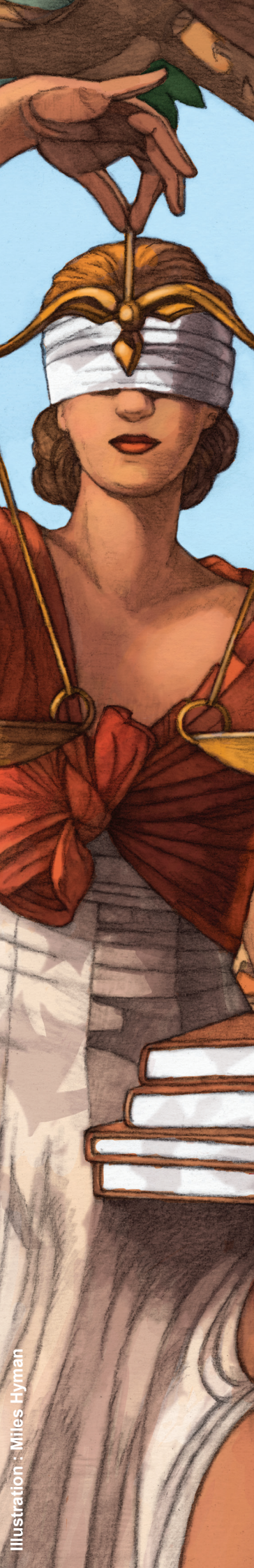
Illustration : Miles Hyman

Centre pour les humanités numériques et l'histoire de la justice CNRS - UMS 3726