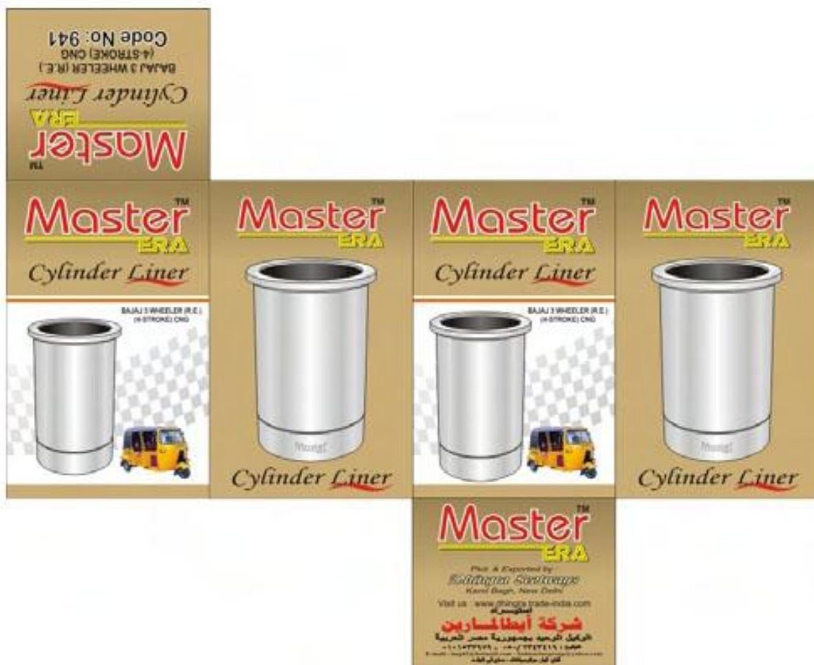
Figure 3 - Master, une marque égypto-indienne de pièces détachées génériques

Entre stratégie de représentation commerciale et recherche de rente, ils conçoivent une identité commune qu'ils déclinent sur leurs emballages. Des labels apparaissent aujourd'hui certifiant la conformité des pièces. Le jeu des qualités, des façons et contrefaçons est non seulement une façon de dériver le marché, mais aussi une manière d'inventer de nouveaux produits et de nouveaux usages. De petits acteurs se disputent des bouts de marché et contribuent par leurs actions tous azimuts à internationaliser la filière du rickshaw à moteur et à construire de nouvelles routes marchandes. Un chantier de recherche s'ouvre, ample et global.