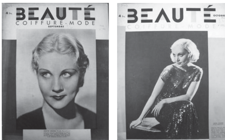
Fig. 2. Couvertures de Beauté, Coiffure, Mode , septembre, octobre 1932, n os 271 et 272, collection privée.

Les numéros de septembre et d'octobre 1932 font leur Une 11 avec des photographies de deux actrices américaines, Judith Wood (septembre 1932) et Carole Lombard (octobre 1932) aux cheveux blond platine (fig. 2). Le « blond platine » est disséminé au fil des pages et des numéros et est associé à la vedette de cinéma : avoir les cheveux blond platine, c'est avoir l'élégance et le goût d'une vedette. Selon Edgar Morin (1972), l'expression de « blond platiné » vient de l'actrice Jean Harlow et du film de Frank Capra The Platinum Blonde , dont elle est l'actrice vedette en 1931. Cet exemple confirme une fois de plus la mise en évidence d'un système de création de récits médiatiques unifiés. Si cette cohérence n'apparaît pas lors d'un simple feuilletage du magazine, c'est parce que les éléments qui la composent sont disséminés dans le titre et dans le temps. Seul un travail de reconstitution soigneux permet de la mettre en évidence.