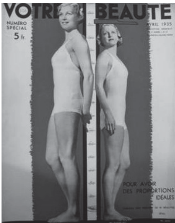
Fig. 6. Couverture de Votre Beauté , avril 1935, n°37 (nouvelle numérotation), collection privée.

La minceur est associée, notamment depuis les années 1920, à une forme de liberté. Ce modèle hérité du personnage de la garçonne 28 signifie la volonté des femmes issues des milieux aisés de se détacher des carcans imposés à leurs corps. Cette silhouette élancée, aux cheveux raccourcis, portant des vêtements fluides et non-entravants ne résiste pas durablement 29 et va coexister avec un corps soigné à l'extrême. Ce dernier, promu par les industries cosmétiques à travers