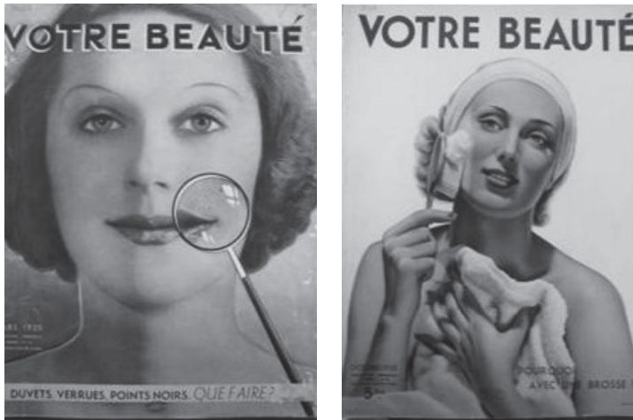
Fig. 9. Votre Beauté , mars et octobre 1935, n°36 et 43, collection privée.

numéro d'octobre 1935, une femme se lave soigneusement le visage avec une petite brosse (photo Meerson) (fig. 9).