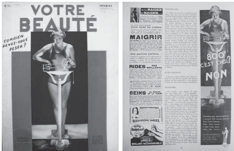
Fig. 3. Couverture de Votre Beauté , février 1933, n°276 et Votre Beauté , mai 1933, n°279, p. 36, collection privée.

Beauté , garder un corps de jeune femme en bonne santé 26 . Le premier article est illustré par un dessin de silhouette à la taille fine et aux hanches légèrement arrondies et sur la page suivante, deux photographies de jeunes femmes (studio Wild World) sont légendées « La danse rythmique est un sport à la mode parmi la jeunesse féminine. C'est l'école de la grâce et du charme ». Les images montrent des corps élancés, fins gracieux et confirment visuellement le texte des articles ou des légendes. La minceur, selon le magazine, symbolise la capacité des femmes à se contrôler et paradoxalement, compte tenu du grand nombre d'actions qu'il faut entreprendre pour l'acquérir et la garder, à être « libre » 27 . Cette idée du contrôle s'incarne dans des formes visuelles mettant en scène des outils de mesure (fig. 3, 4, 5, 6). Les images sont fabriquées en conséquence : photomontages, alliances entre photographie et dessin, ou mises en scène photographiques permettent de soutenir la narration élaborée par la rédaction.