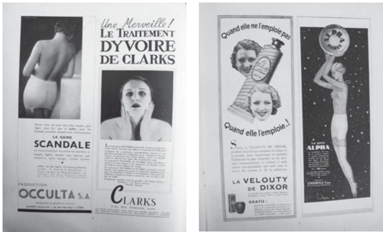
Fig. 8. Votre Beauté , publicités, février 1934, n°288, p. 2 et 7, collection privée.

Visuellement, ce récit s'accompagne encore d'images repérables : les femmes, souvent de dos, affichent une silhouette récurrente, aussi bien dans le contenu éditorial que dans le contenu publicitaire (fig. 8). Ce modèle de silhouette unifiée permet d'une part, d'évacuer tout autre proposition, et de l'autre de transformer l'information commerciale en information journalistique ou « l'histoire en nature » 32 .