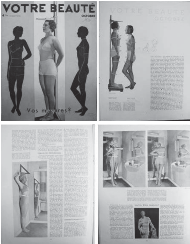
Fig. 4. Votre Beauté , octobre 1933, n°284, couverture, p. 9, 14 et 16, collection privée.