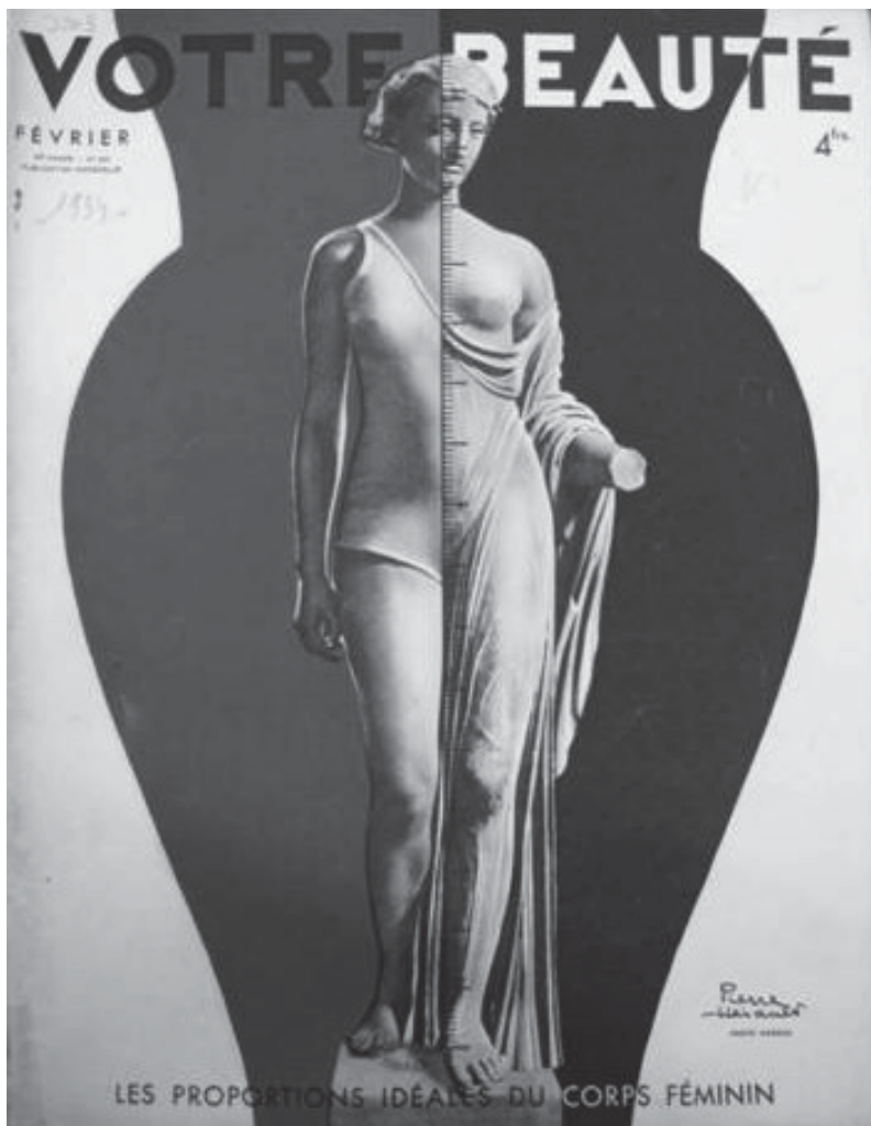
Fig. 5. Couverture de Votre Beauté , février 1934, n°288, collection privée.