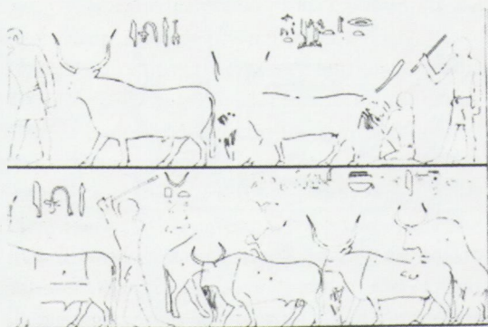
fig. 4 Scène du mastaba d'Ibi (paroi nord) N. De Garis Davies, The Rock Tombs of Deir el Gebrâwi – part I , Londres, 1902, pl. XI

Un dernier exemple provient du célèbre mastaba de Ty (V e dyn., Saqqâra). Il s'agit d'une scène dans laquelle évoluent un certain nombre de personnages occupés à nourrir différents groupes d'oiseaux, notamment en les gavant [fig. 7]. Tous les oiseaux y sont à la fois nommés et représentés de façon à pouvoir aisément les distinguer. À deux reprises, c'est le mot ꜥpd(.w) , "oiseaux", qui est utilisé pour désigner les volatiles plutôt que leur nom particulier (inscription en colonne à gauche de la scène). S'agissant d'un terme générique, on s'attendrait, comme c'est le cas dans la plupart des occurrences de ce mot, à le voir déterminé par l'un des deux hiéroglyphes prototypiques de la catégorie des oiseaux : l'oie \text{𓂏} (G38) ou le canard \text{𓂐} (G39). Mais à la place de ces signes apparaissent deux représentations en miniature des oiseaux en train d'être gavés dans la scène associée.