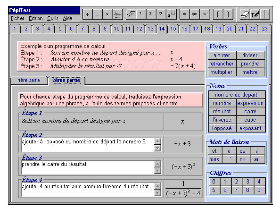
Figure 4 : Un exemple de tâche dans PÉPiTEST.