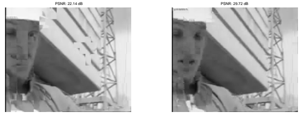
FIGURE 2 – Résultats visuels de la SI finale de notre méthode (à droite - PSNR = 29.72 dB) comparés avec DISCOVER (à gauche - PSNR = 22.14 dB) - Trame numéro 92 de la séquence Foreman.

où \text{MAD}_p et \text{MAD}_n sont les différences absolues moyennes entre le bloc considéré dans la PDWZF et les blocs correspondants dans les trames de référence précédente et suivante, respectivement, et T_2 constitue un seuil.