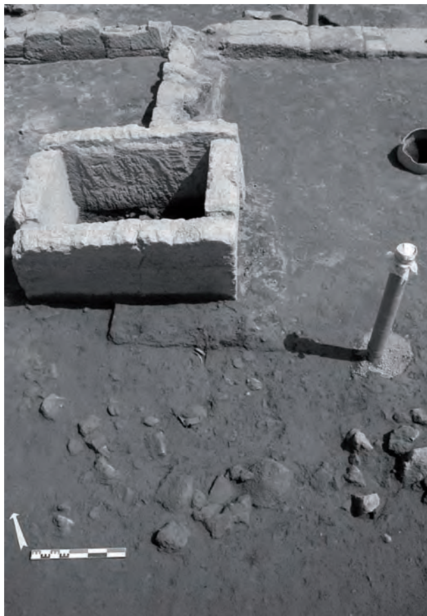
Fig. 3. La fossa FS700114 degli ultimi decenni del IV sec. a.C..

Le terrecotte architettoniche comprendono due tipi di elementi di diversa funzione nel sistema di copertura (acroterio e antefisse) e quattro temi decorativi: la maschera di Gorgo, la testa femminile, la palmetta diritta e la palmetta rovescia 15 . L'associazione di queste terrecotte architettoniche su uno stesso tetto corrisponde al sistema di copertura campana 16 . Sulla base delle loro dimensioni, questi elementi non possono essere attribuiti ad un unico tetto; si potrebbe associare con l'acroterio a disco l'antefissa