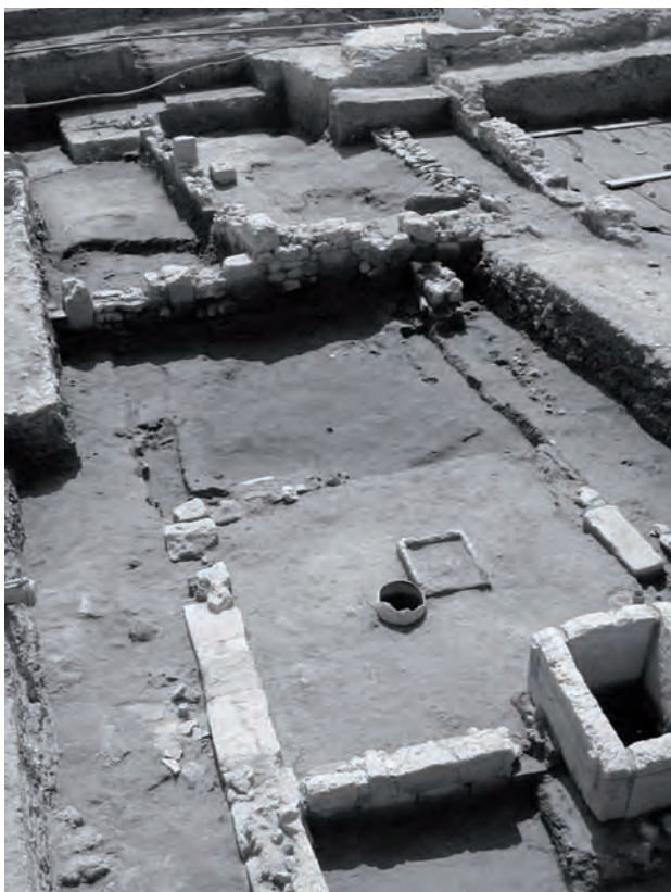
Fig. 2. Sala con focolare al centro, probabilmente per banchetti rituali.

su tre lati il bordo superiore esterno modanato e il piano centrale risulta leggermente incassato. Il focolare poggiava su uno spesso piano pavimentale in taglime di tufo; l'assenza di quest'ultimo lungo le pareti dell'ambiente e le tracce in negativo di apprestamenti lasciano supporre, almeno nell'ultima fase di frequentazione, la presenza di panchine.