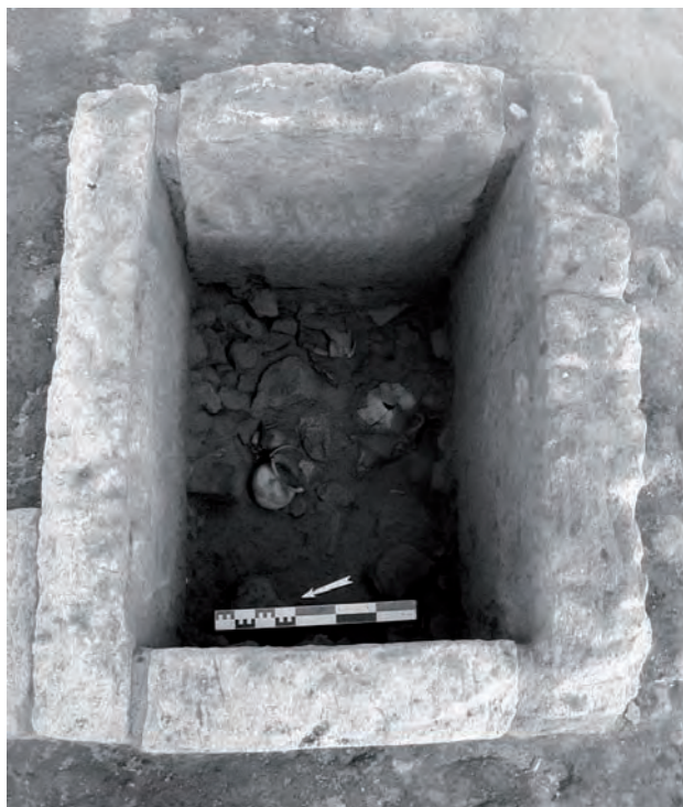
Fig. 4. Struttura SB700106 composta da quattro lastre di tufo infisse nel terreno.

I precedenti scavi a Cuma hanno restituito un unico acroterio circolare, di ridotte dimensioni (diam. cm 18), con gorgoneion reso con pochi tratti a rilievo. Da Capua provengono tre acroteri a disco con raffigurazioni di Gorgo ma sono tuttavia molto diversi: uno è nimbato ed il viso di Gorgo, reso senza rilievo, è dipinto, gli altri due sono privi di cornice: entrambi conservano solo il medaglione e