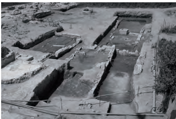
Fig. 1. Cuma. Veduta dall'alto del complesso di VI-I secolo a.C. (Foto: J.-P. Brun/CNRS-CJB).