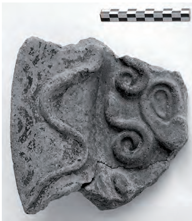
Fig. 5.* Acroterio a disco inv. 700114.01.

rappresentano Gorgo con capigliatura a linguette o arricciata; della stessa provenienza sono varie antefisse nimbate con diversi tipi di gorgoneia.