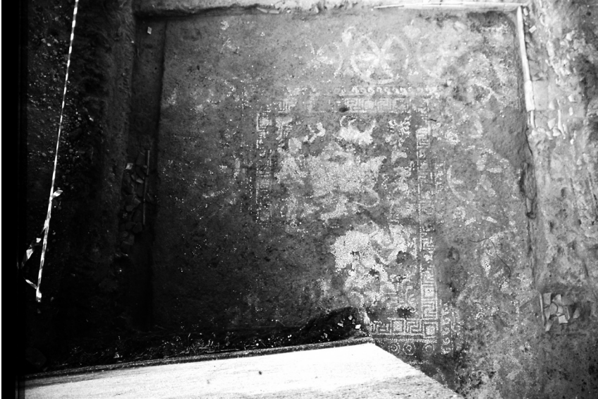
Fig. 5 - Stanza (P) con pavimento a mosaico «dei tori rampanti».