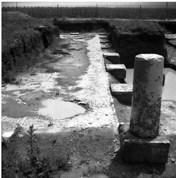
Fig. 8 - Foto dello scavo in corso del peristilio con colonne e pavimento a ciottoli.