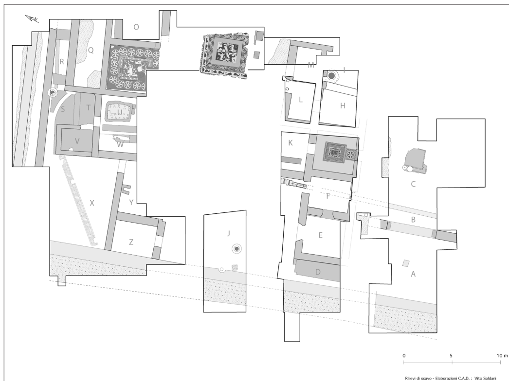
Fig. 1 - Pianta generale della domus (elab. V. Soldani, Centro Operativo per l'Archeologia della Daunia, Soprintendenza Archeologia della Puglia).