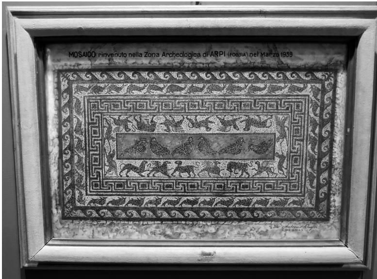
Fig. 10 - Museo Civico di Foggia: acquerello del mosaico rinvenuto ad Arpi nel marzo 1939.