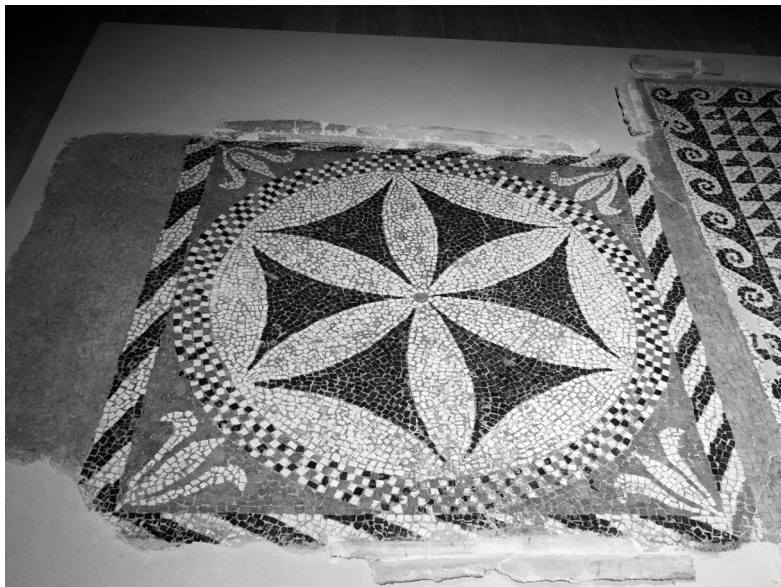
Fig. 11 - Museo Civico di Foggia: mosaico policromo con rosetta a sei petali e palmette angolari dall' andron in opus tessellatum a tessere semiregolari.