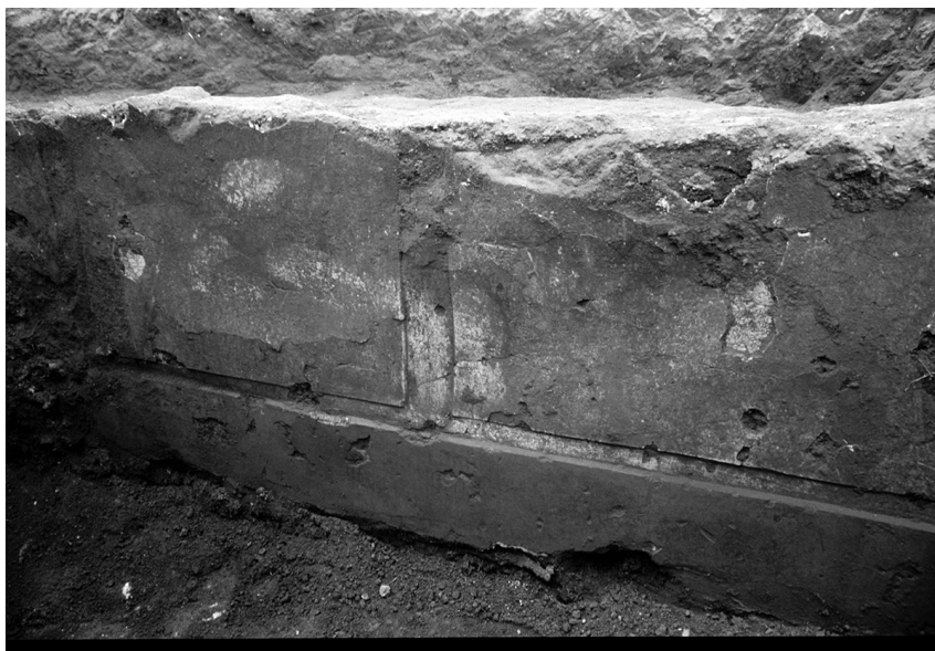
Fig. 4 - Lo spazio «a peristilio» (N). Dettaglio del muro N con la sua decorazione intonacata e dipinta in stile strutturale.