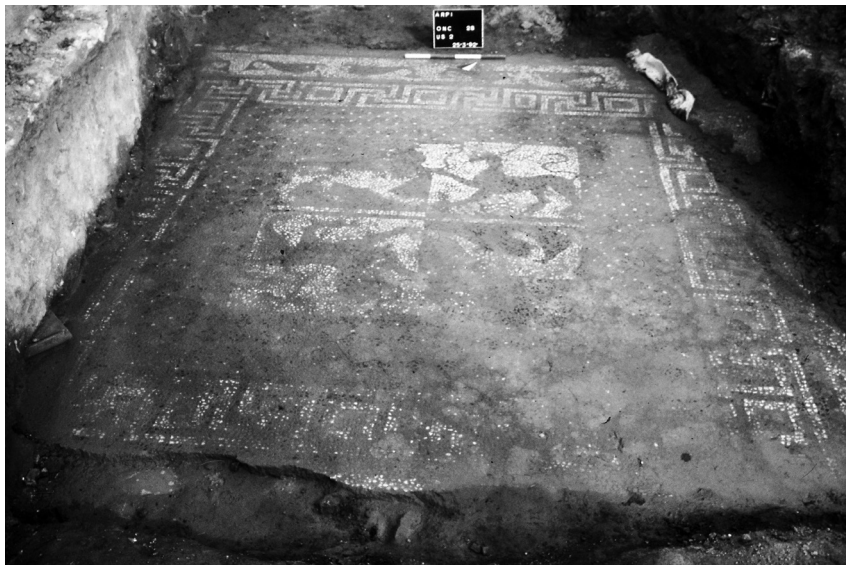
Fig. 3 - Lo spazio «a peristilio» (N) con il pavimento a mosaico «dei leoni e delle pantere».