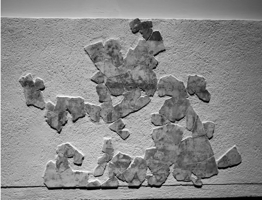
Fig. 16 - Museo Civico di Foggia: fascia dipinta del vano N con resti di iscrizione, kyma lesbio, kyma ionio e fregio di palmette.