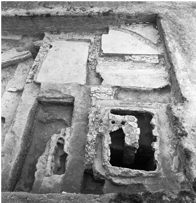
Fig. 6 - Settore nord con spazi cosiddetti «di servizio» (S, T, U, V, W) (foto M. Marchesino, Archivio Soprintendenza Archeologia della Puglia - Centro Operativo per l'Archeologia della Daunia).