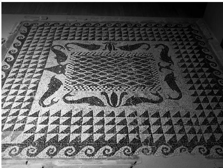
Fig. 12 - Museo Civico di Foggia: mosaico con delfini convergenti verso palmette e verso bucrani dall' andron in opus tessellatum a tessere semiregolari.