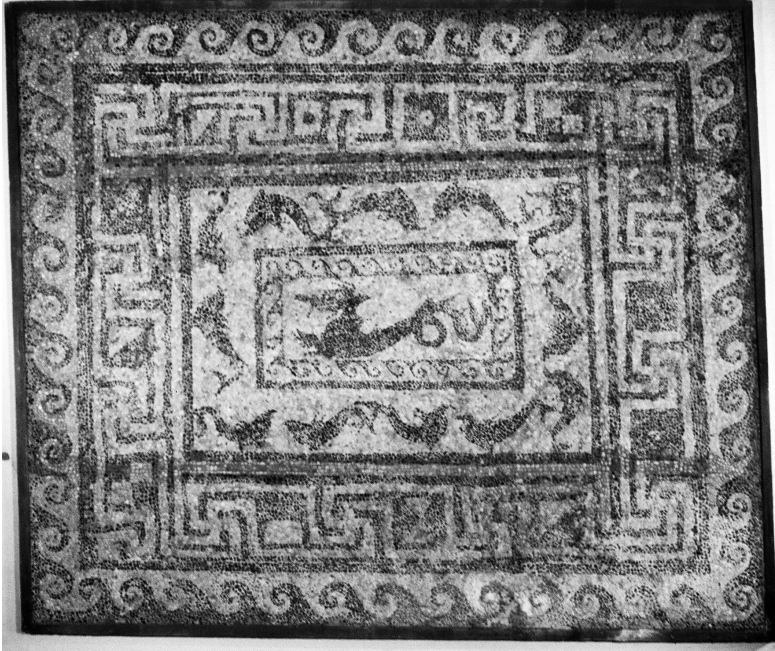
Fig. 9 - Pavimento a mosaico della domus «a peristilio» conservato presso il Museo Civico di Foggia.