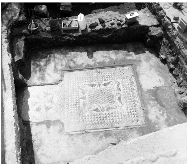
Fig. 2 - L' andron e il suo pavimento a mosaico.