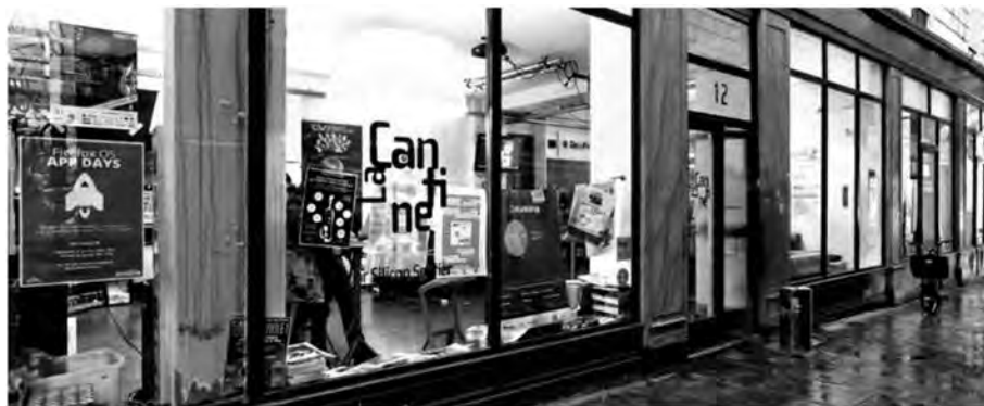
Illustration 2. La vitrine de La Cantine 15

Une seconde forme d’ambiguïté, cette fois-ci de nature architecturale, réside précisément dans cet acte : franchir la porte et accéder directement au sein d’un espace habité. Cette facilité d’accès met très rapidement « l’étranger » dans le rôle d’usager, sans lui donner le temps ni l’espace pour préparer cette transition. Bien que différentes formes de hiérarchie lui seront rendues visibles par la suite, notamment à travers la répartition des activités dans l’espace, celles-ci sont de prime abord indiscernables dans l’expérience de l’étranger : les personnes se confondent dans cette configuration pauvre en signes distinctifs. Ainsi, à l’idée de transparence véhiculée par la vitrine et à la facilité d’accès, s’ajoute l’absence de contraintes architecturales particulières, de contrôle d’accès, mais aussi d’une attention ciblée.