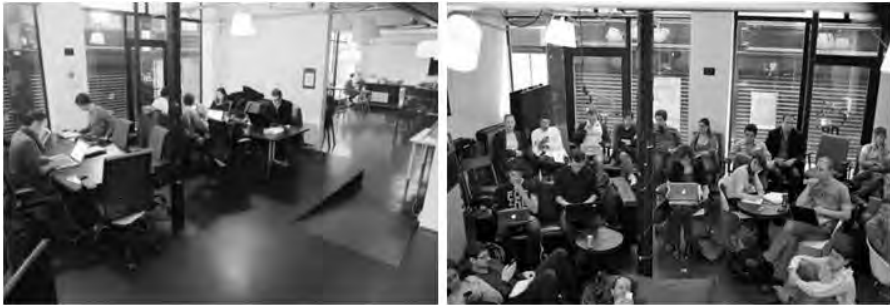
Illustration 3. Aménagement en coworking (à gauche) et pendant les événements (à droite) 16

Ainsi, bien que la rhétorique officielle mette l'accent sur les aspects liés à l'accessibilité physique de cet espace-café appelé aussi « espace gratuit », l'organisation de la mise en relation se fait ici tout autant par l'agencement des contraintes. En effet, cet espace à l'entrée n'est pas le plus approprié pour travailler. C'est un peu plus loin de l'entrée, et de la machine à café, dans l'espace suivant, ledit coworking qu'a priori se tiennent les activités de travail demandant plus de concentration et de temps. Du type open space , ce dernier est équipé de deux grandes tables pliables et de fauteuils de bureau, dont la disposition est recomposée par les usagers achetant des tickets pour y accéder à la journée ou au mois. Fondé sur le principe du « sans bureau fixe », il ne fournit cependant aucune garantie de place ni de confort, pouvant être recomposé à tout moment par l'organisation d'un événement. Ainsi, l'aménagement obéit à des contraintes de mobilité qui supposent une certaine adaptation de la part de ses usagers, y compris les permanents. Elle favorise par la même occasion le turn-over des premiers tout en limitant l'exclusivité.