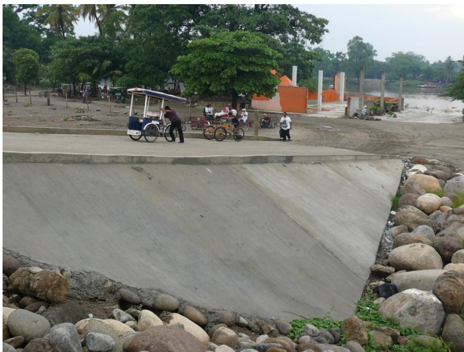
Rampa de concreto permitiendo el acceso a todo tipo de vehículos. Imagen propia, Ciudad Hidalgo, abril del 2013.

Finalmente, durante el proceso electoral en México a final del año 2012 (a nivel federal, y en ciertos estados y municipios, de los cuales Chiapas y Suchiate), los lugares informales de tránsito fueron rehabilitados y se construyeron incluso rampas de acceso de concreto para que los transeúntes, triciclos y vehículos motorizados puedan cruzar el borde de mitigación. Además de esta reconfiguración de los accesos a los pasos informales en Ciudad Hidalgo, observamos un proceso de reacomodación de las actividades económicas informales, es decir, asistimos a un desplazamiento de las actividades de almacenamiento, así como de venta (puestos semifijos de venta de alimentos y artículos diversos), hacia las calles contiguas al bordo.