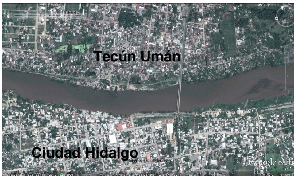
Vista satelital de las orillas del río Suchiate en 2010.

Un episodio revelador fue la construcción de un bordo de contención del río en Ciudad Hidalgo por la Comisión Nacional del Agua (CONAGUA) en México, un proyecto de prevención de catástrofes naturales para minimizar los riesgos de inundaciones y desbordamientos del río Suchiate. La Secretaría de Gobernación autorizó en 2006 un presupuesto de 100 millones de pesos para construir dicho bordo en el municipio. A partir de 2011, los habitantes de las colonias cercanas al río asentadas en terrenos federales del lado mexicano, fueron reubicados e indemnizados, al término de conflictos jurídicos; en este contexto, la Secretaría para el Desarrollo de la Frontera Sur (SDFS) del estado de Chiapas fungió como mediadora entre CONAGUA y los pobladores de las colonias ubicadas a proximidad del río. Durante el año 2012, después de haber derribado las casas y los locales ubicados en la orilla, se efectuaron las obras: se construyeron los dos bordos (uno de aproximadamente 800 metros y otro de 400) en el cauce del río Suchiate.