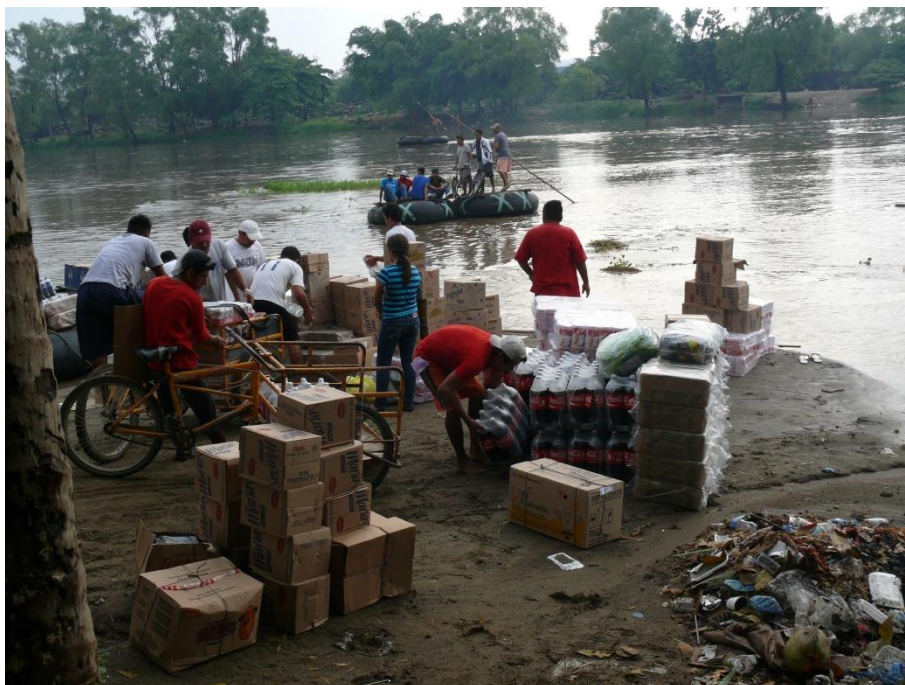
Descarga y traslado de mercancías y personas. Imagen propia, Ciudad Hidalgo, abril 2013.

Efectivamente, numerosos actores individuales y colectivos residentes de la región fronteriza elaboran estrategias en base a las discontinuidades generadas por la división político-administrativa. Ello da lugar a circuitos transfronterizos informales de flujos de mercancías cuya direccionalidad e intensidad son determinadas por las diferencias de tipo de cambio, las diferencias de precio de ciertos productos y de acuerdo con la especialización productiva de cada país. Como ejemplos, podemos citar el traslado de frutas y verduras de Guatemala a México, y al revés, el traslado de bienes de consumo corriente (refrescos, derivados de trigo, sal, aceite comestible, etc.), de alcohol y de combustibles; en efecto, mientras el combustible es subvencionado del lado mexicano, se vende al precio del mercado internacional en Guatemala.