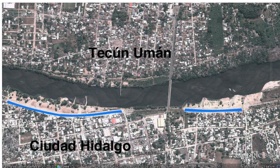
Vista en 2013 posteriormente a la construcción de los bordos de contención (en azul). Imagen editada por el autor; fuente original: Google earth

¿En qué sentido fue revelador? La construcción del bordo de mitigación generó una crisis desestabilizando el sistema de transporte informal; suscitó una reacción por parte de los grupos involucrados y dejó entrever ciertos mecanismos de mediación entre los gobiernos locales y los actores que pertenecen al sector informal de la economía fronteriza.